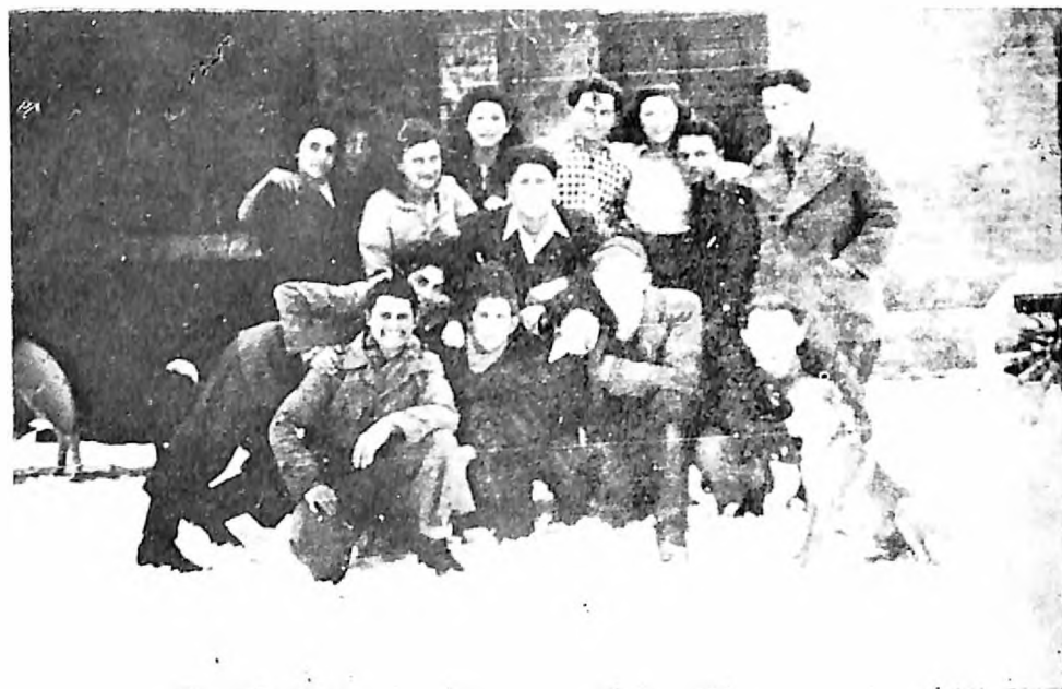
Članovi Hašomer Hacaira iz Novog Sada na Hahšari kod Podravske Slatine