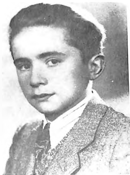
Singer Đerd iz Bačke Topole, poginuo u pobuni u Satoralijaujhelju. Vođa omladinske grupe koja je vršila proboj iz zatvora