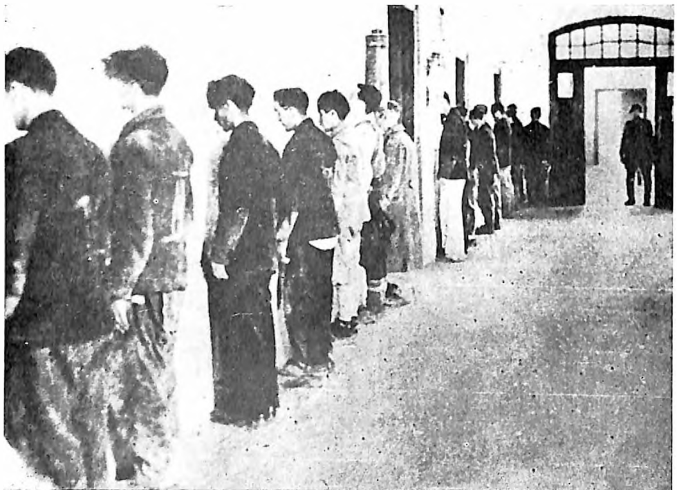
Metode mučenja u logoru na Banjici