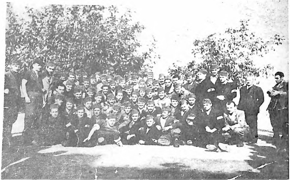
Tzv. 451. kažnjenički bataljon sastavljen iz političkih osuđenika iz Subotice, na svom putu za Istočni front — oktobar 1942. godine