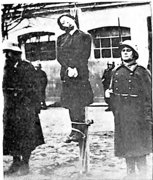
Vešanje Livije Bem u Novom Sadu decembra 1941. godine