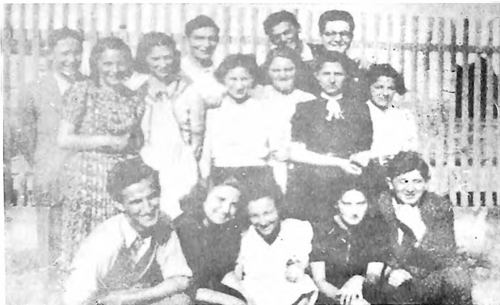
Deo kena Hašomer Hacaira u Novom Sadu