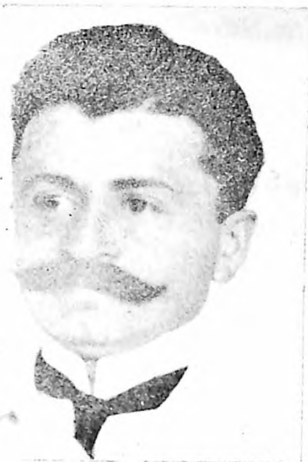
Dr Bukić Pijade

Vojaske 20/X/1912 Zdravo U ovom je trenutku u koje je po juru i onako nepredviđeno patiti od jake bolesti koja je u ovom i kod da o njemu ne mogu reći ništa jer bez obzira na to, u ovom trenutku ne mogu reći ništa više nego da je to nešto što se može dogoditi i kod ljudi koji su u najboljoj zdravstvenoj situaciji. U ovom trenutku ne mogu reći ništa više nego da je to nešto što se može dogoditi i kod ljudi koji su u najboljoj zdravstvenoj situaciji. U ovom trenutku ne mogu reći ništa više nego da je to nešto što se može dogoditi i kod ljudi koji su u najboljoj zdravstvenoj situaciji. U ovom trenutku ne mogu reći ništa više nego da je to nešto što se može dogoditi i kod ljudi koji su u najboljoj zdravstvenoj situaciji. U ovom trenutku ne mogu reći ništa više nego da je to nešto što se može dogoditi i kod ljudi koji su u najboljoj zdravstvenoj situaciji.