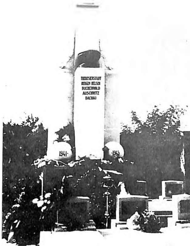
Spomenik Jevrejima borcima protiv fašizma i žrtvama fašizma na jevrejskom groblju u Subotici. Ispred i oko spomenika su grobovi Jevreja obešenih 18. novembra 1941. od strane okupatorskih vlasti