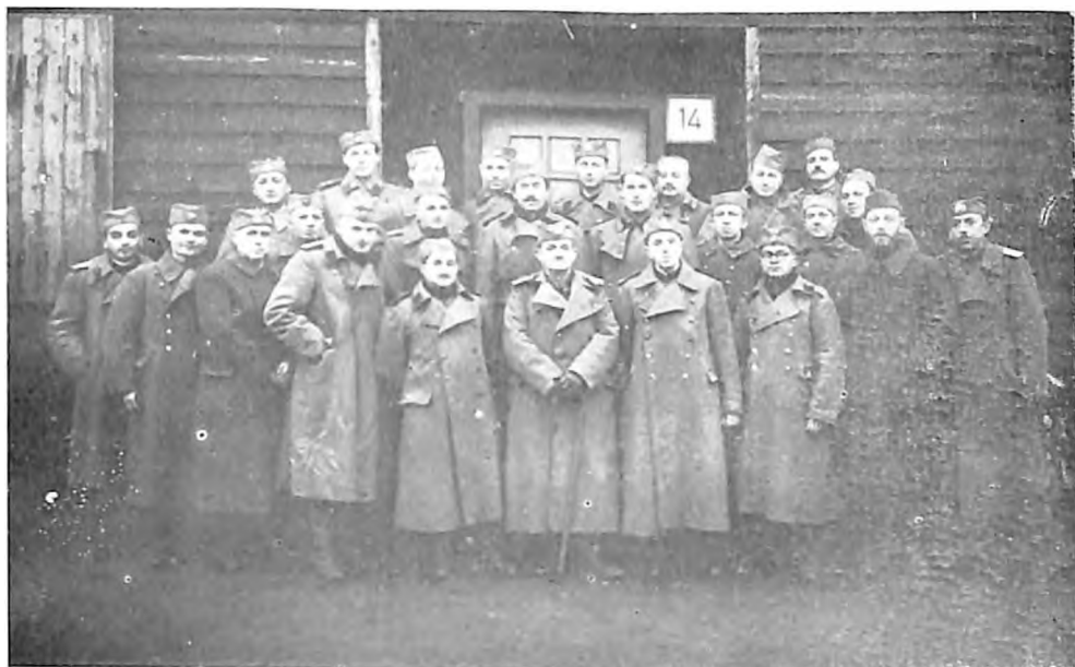
Grupa Jevreja rezervnih jugoslovenskih oficira u nemačkom ratnom zarobljeništvu 1942. godine u Osnabriku