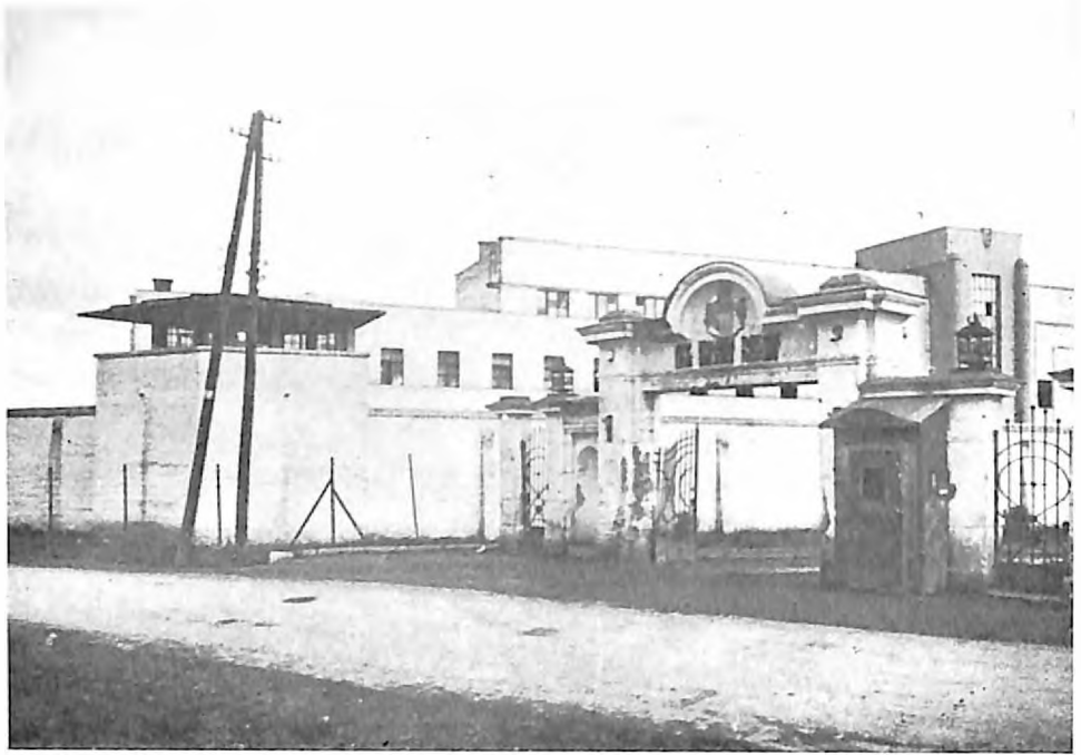
Logor na Banjici, ulaz