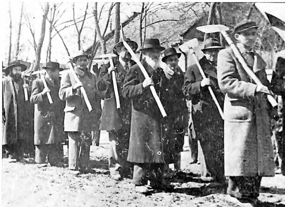
Internirani Jevreji na prinudnom radu Senta, april 1941.