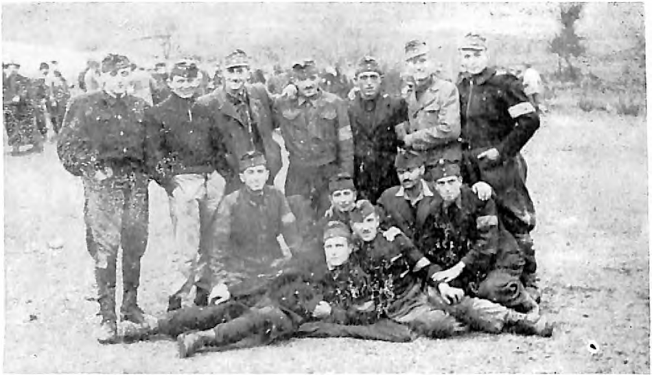
Grupa Jevreja na prinudnom radu u Boru