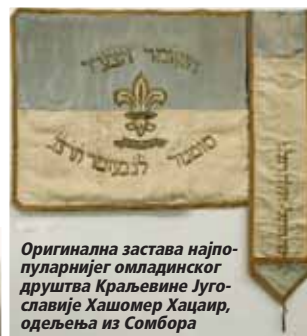
Оригинална застава најпопуларнијег омладинског друштва Краљевине Југославије Хашомер Хацаир, одељења из Сомбора

Омладинска радничка и студентска друштва, њихови скупови и заједничке активности, излети, радна камповања (хахшаре – обучавање у пољопривредним и занатским делатностима као припрема за одлазак у Израел, и боравак у тзв. мошавама – омладинским камповима).