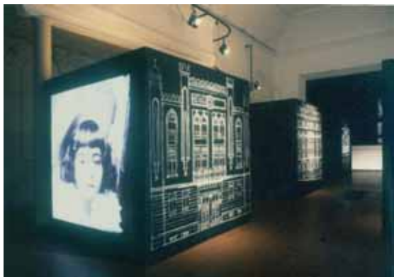
„Прича о комшијама којих више нема“ (деталј)