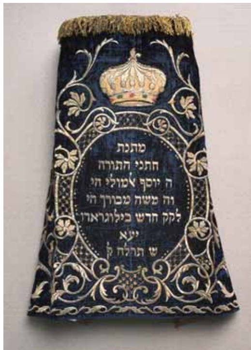
Везене тканине, детаљ

- Јевреји Дорћола – Прича о комшијама којих више нема , приређена је у Рексу, Београд, 1997., а гостовала је у Ерфурту, у Немачкој, 1998.;