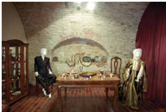
„Животни циклус - обичаји код Јевреја“ (деталј)

- Животни циклус - обичаји код Јевреја , приређена у Конаку кнегиње Љубице, Београд, 1998. године, поводом 50-годишњице постојања Јеврејског историјског музеја;