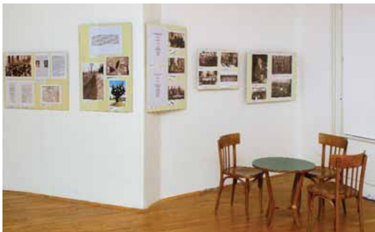
„Савез јеврејских општина 1919 – 2009“ (деталј)

- Савез јеврејских општина 1919 – 2009, од Краљевине Срба, Хрвата и Словенаца до Републике Србије , Центар за културу Стари град, Београд 2010.