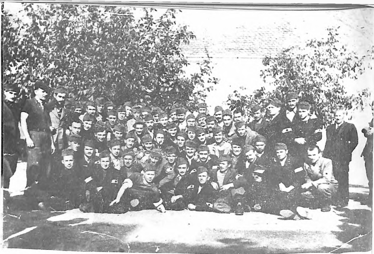
Kažnjenička radna jedinica iz Subotice Jevreja i nejevreja 1942. godine u Kiskun Halašu prilikom deportovanja u Ukrajinu