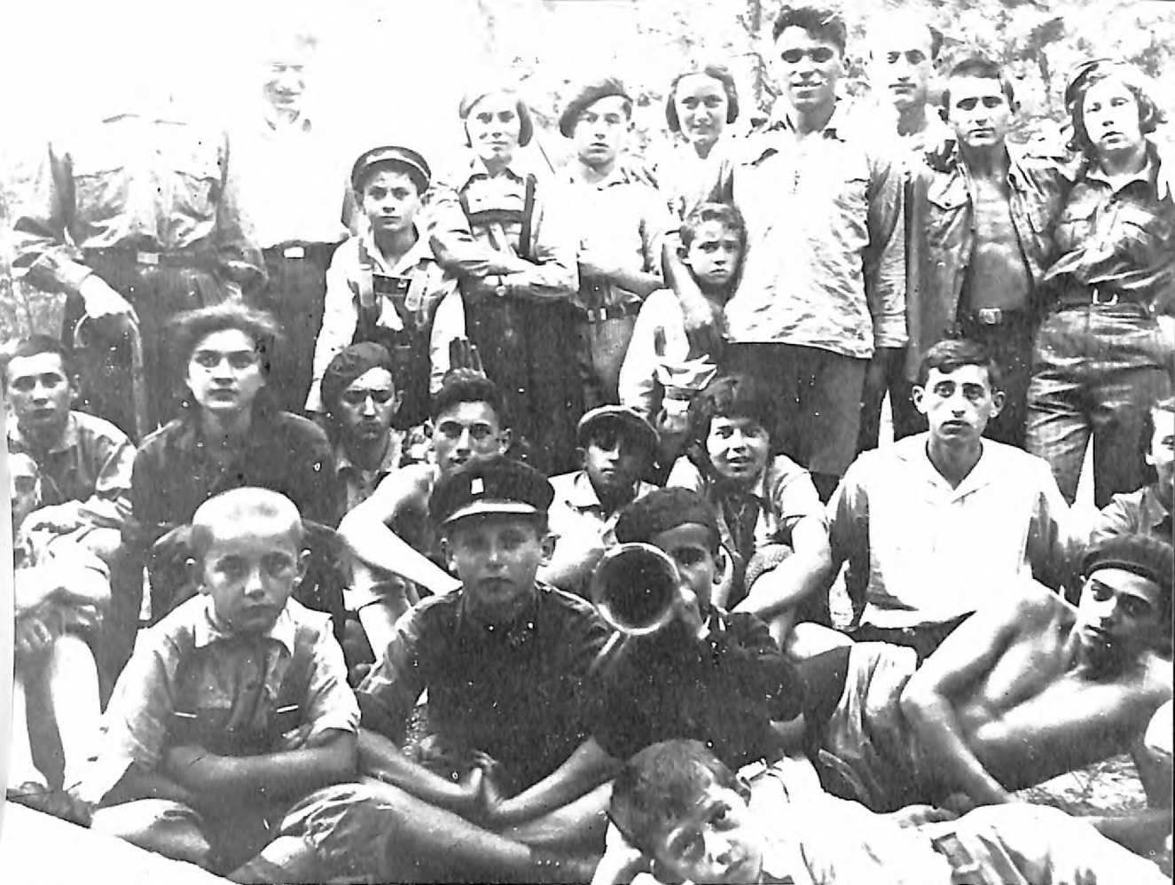
Grupa subotičkog Hašomer Haccaira na Paliću 1934. godine