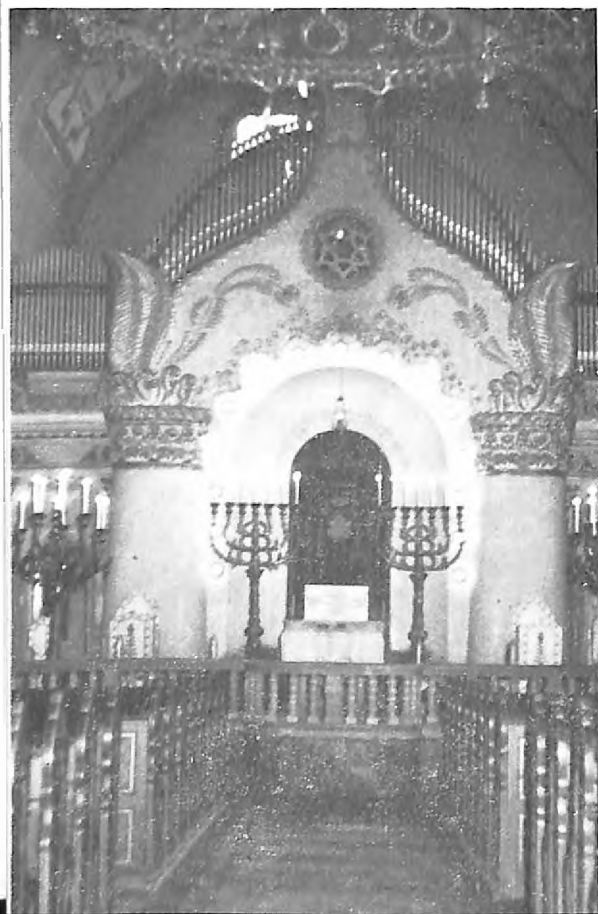
Detalj enterijera subotičke sinagoge