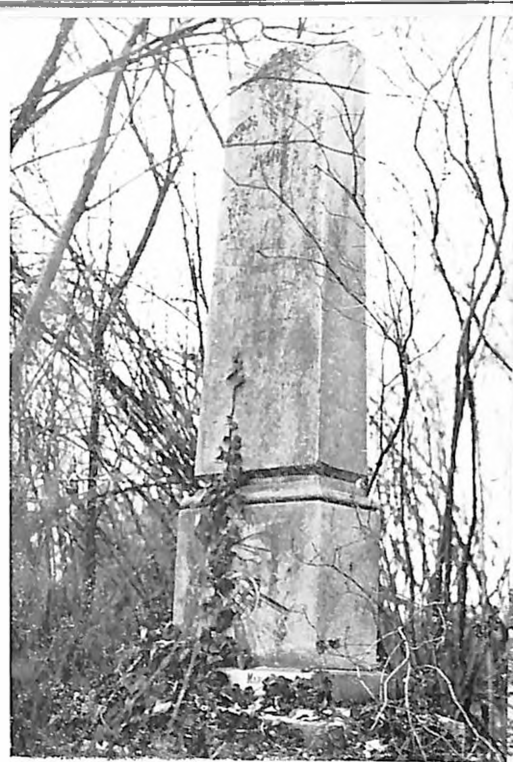
Spomenik Jevrejima iz Subotice koji su poginuli u revolucionarnim događajima 1848—49. godine