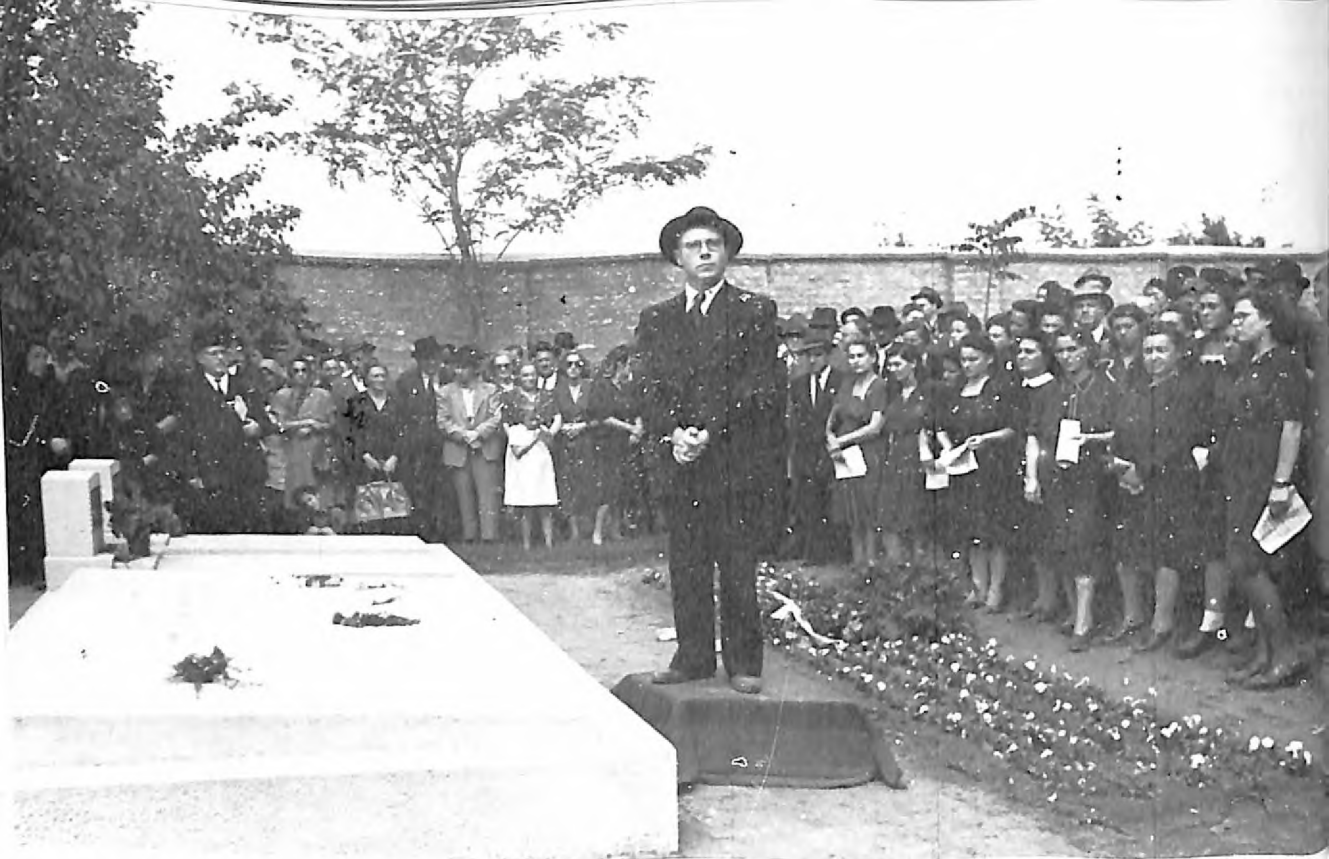
Osvećenje spomenika Jevrejima žrtvama fašističkog terora u Subotici. U pozadini jevrejski hor »Hakinor«