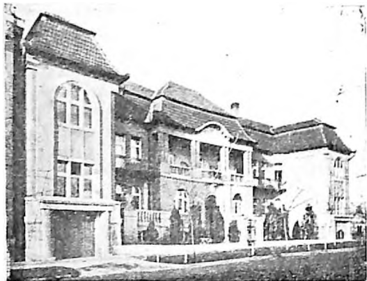
JEVREJSKA BOLNICA SUBOTICA