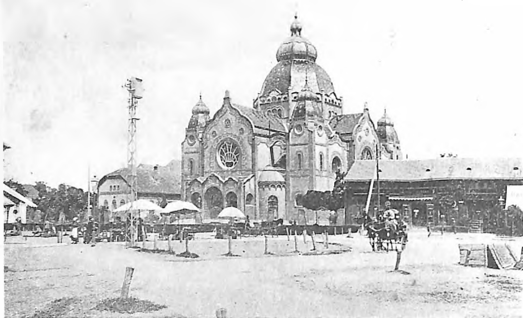
Izgled subotičke sinagoge pre prvog svetskog rata