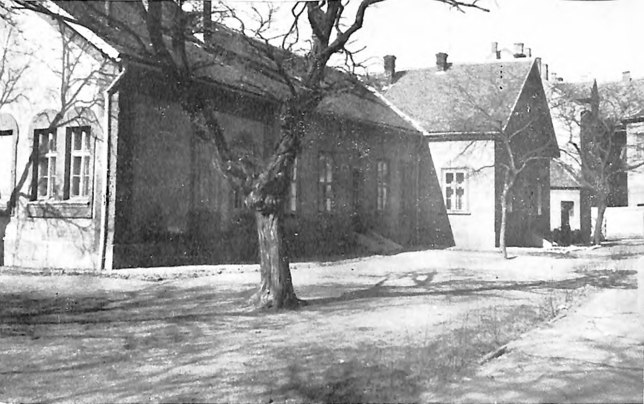
Zgrada jevrejske škole u Subotici