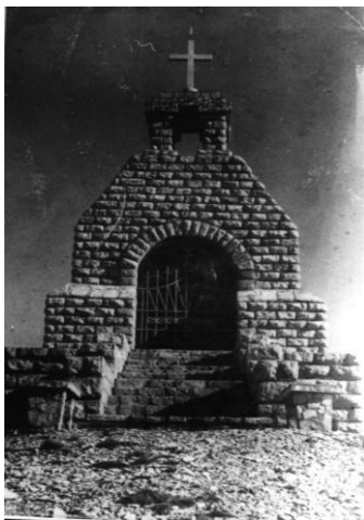
Kapela – crkva na vrhu Rtnja 1936. godine