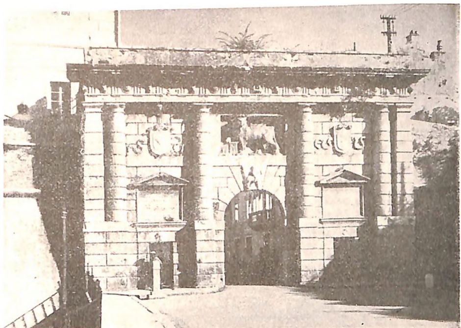
Zadar, gradska kapija Porta di Terraferma