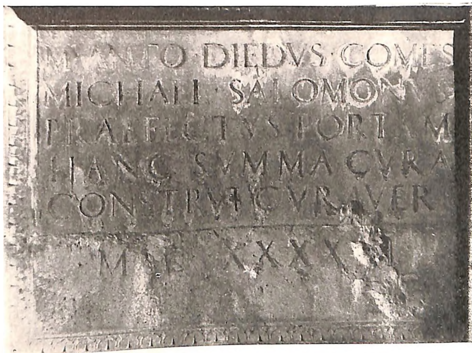
Zadar, ploča na gradskim vratima Porta di Terraferma, iz koje se vidi da je kapiju saziđao neki Michaeli Salomonus