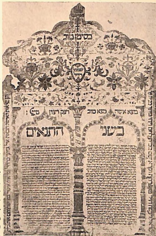
„Ketuba“ ženidbeni ugovor, Split, god. 1644

Sredinom 18. stoljeća Jevreji se počinju pomalo naseljavati u pojedinim gradovima Hrvatske i Slavonije. U Osijeku živjele su god. 1746 dvije jevrejske obitelji, koje su nakon par godina opet istjerane. Tek od god. 1776 počeli su Jevreji opet dolaziti pomalo