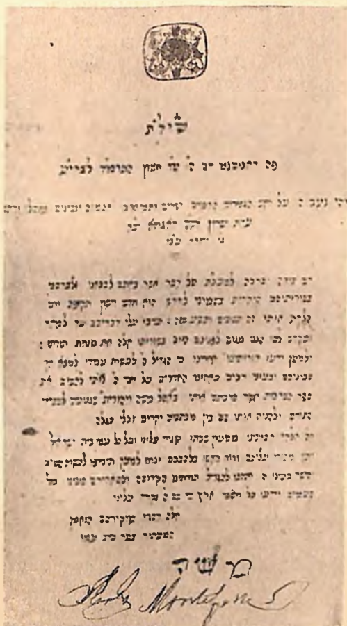
Zahvalno pismo Mosesa Montefiore koje je on lično predao predstavnicima dubrovačke jevrejske općine prilikom stogodišnjice njegovog rođenja.

bečkom konzervatoriju, nadalje dobrotvora Lavoslava Schwarz, liječnika Dra. Moritza Weissa, koji je prvi počeo održavati u Zagrebu medicinska predavanja, te Davida Schwarz; stvarnog izumitelja Zeppelinova zrakoplova. U 19. stoljeću ima već čitav niz jevrejskih liječnika i to ne samo u Zagrebu, nego i u drugim mje-