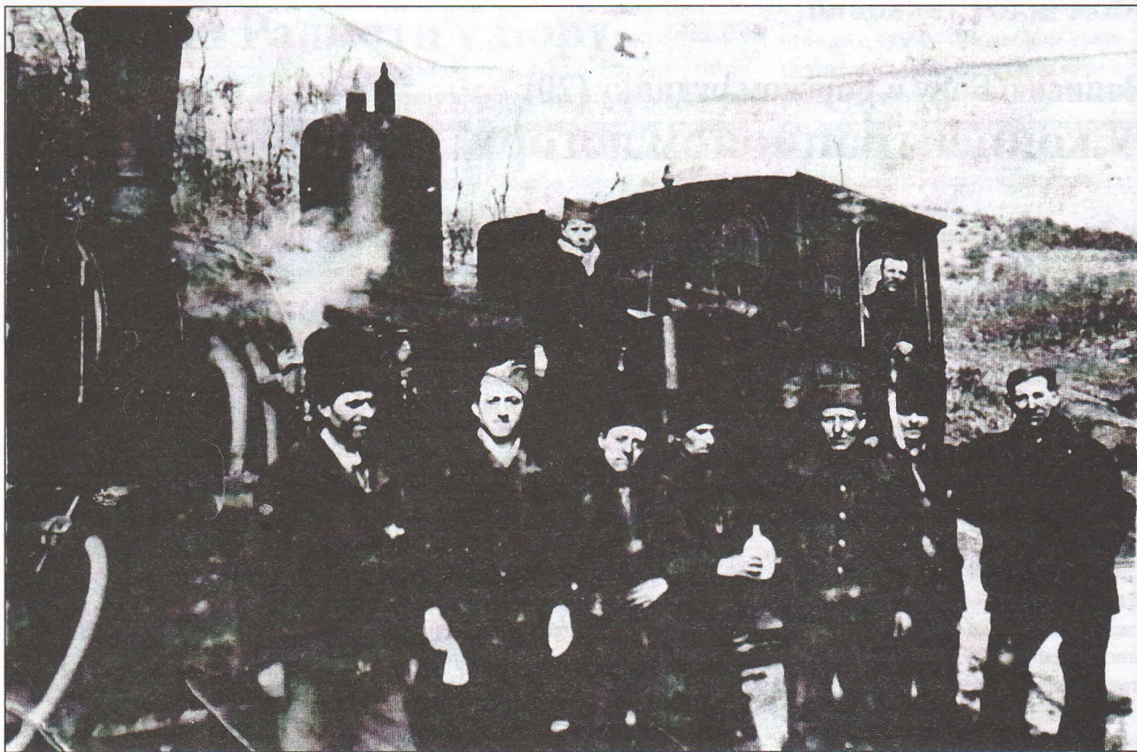
Затвореници једној од радних лоџора код Бора

ваца. Из овог се логора ишло на рад под стражом углавном на раскривкама бакарне руде по радилиштима Тилва мика и Тилва рош. Рад се тамо обављао по утврђеним нормама. Сви који не би испунили прописану норму оштро су кажњавани. Некима је ускраћиван ручак, другима и ручак и вечера, а затим су следиле казне затвора у трајању од једног до шест месеци, које су издржаване у „Штраф-лагеру“. Није било ноћи, а да пијани тотовци не сврате у коју бараку, разбуде уморне људе, провоцирају их и на најмању приредбу шамарају их и батинају штаповима. Они најокорелији сматрали су за изузетно задовољство да групе дотераних изводе у хладну ноћ и да тамо, пијани, обављају са њима егзерцир.