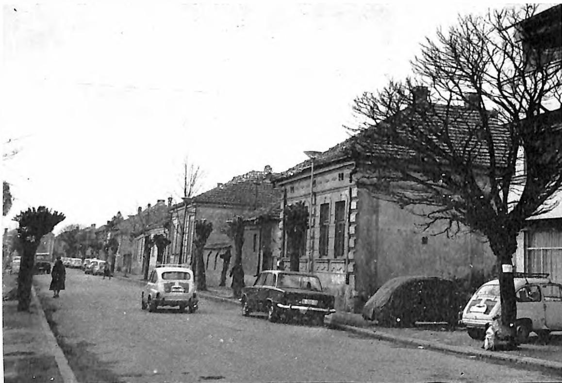
3. Deo nekadašnje jevrejske mahale u Pirotu u Sarajevskoj ulici (sada ul. Svetozara Markovića)