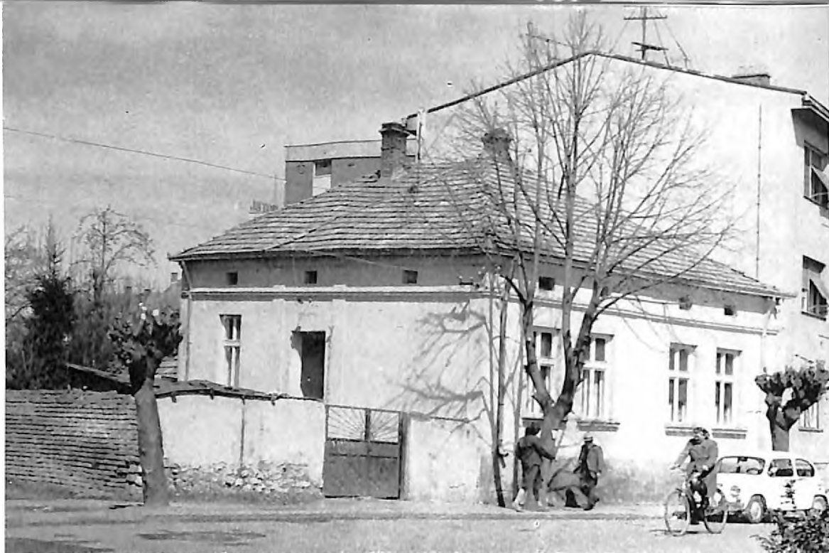
2. Prizemna kuća u ul. Vojvode Stepe Stepanovića br. 6 u Pirotu — jedina zgrada na terenu gde su nekada bile i zgrade sinagoge, jevrejske škole i jevrejske opštine