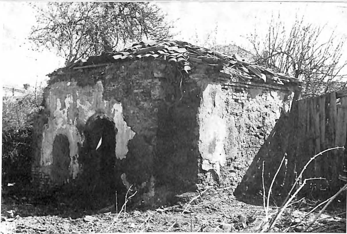
4. Ruševine starog ritualnog kupatila u dvorištu sinagoge u Pirotu