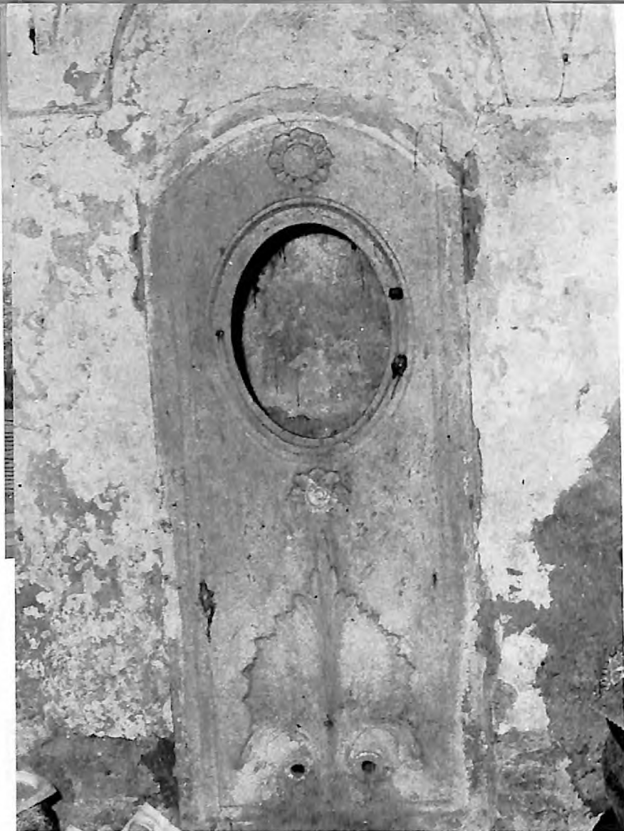
6. Mermerna ploča na istočnom zidu starog ritualnog kupatila u Pirotu