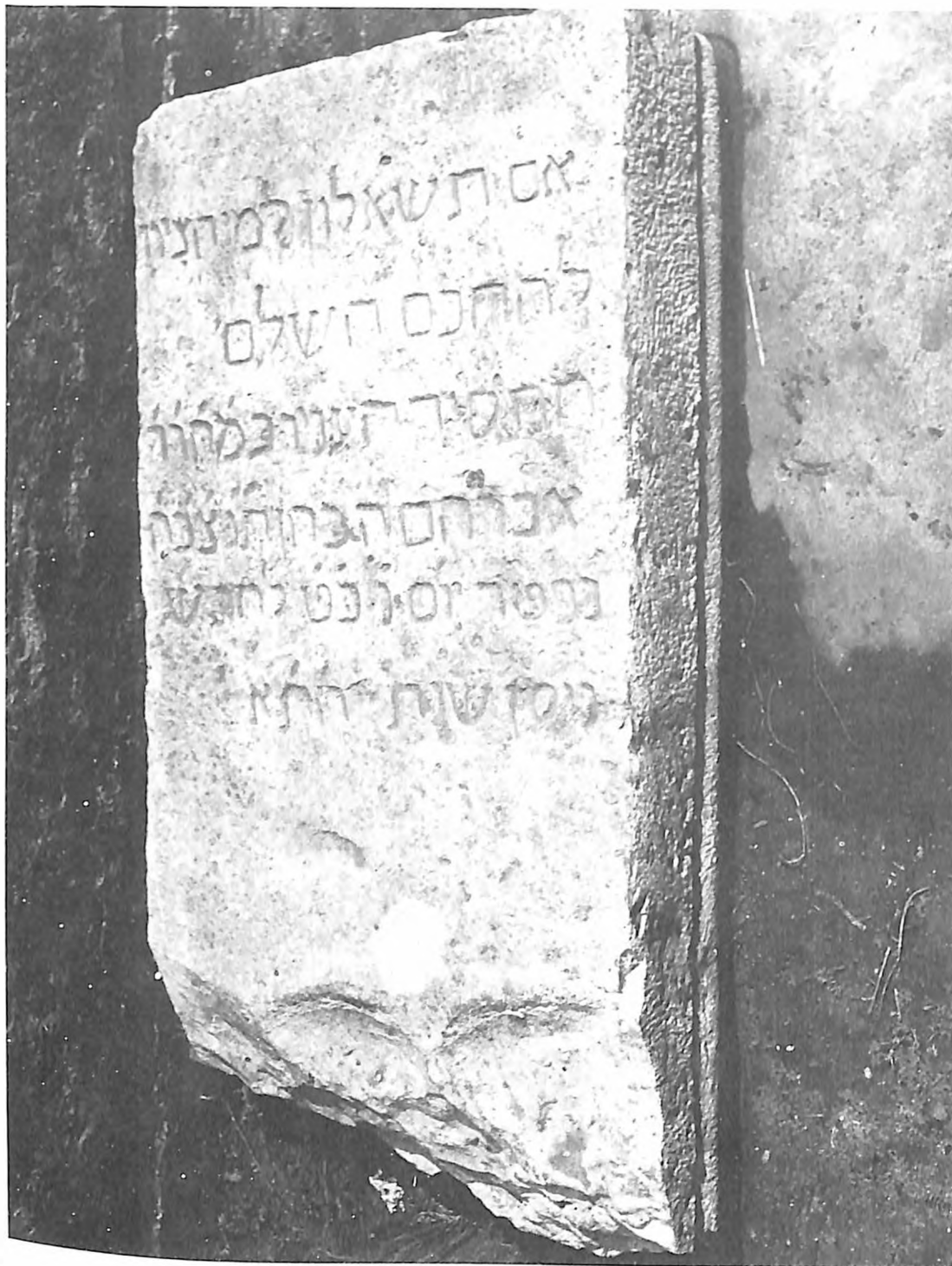
Nadgrobná ploča našena prilikom podizanja zgrade na uglu Zmaj Jovine ulice i Obilježevog venca, danas u dvorištu sinagoge, M. Birjuzova 19, 1641. god.