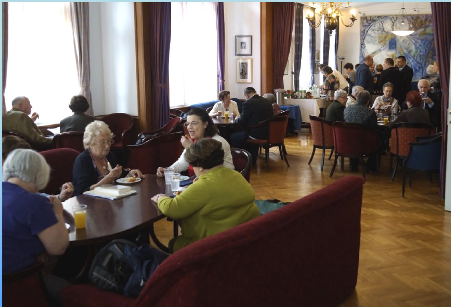
Za vrijeme ručka u klubu Židovske općine