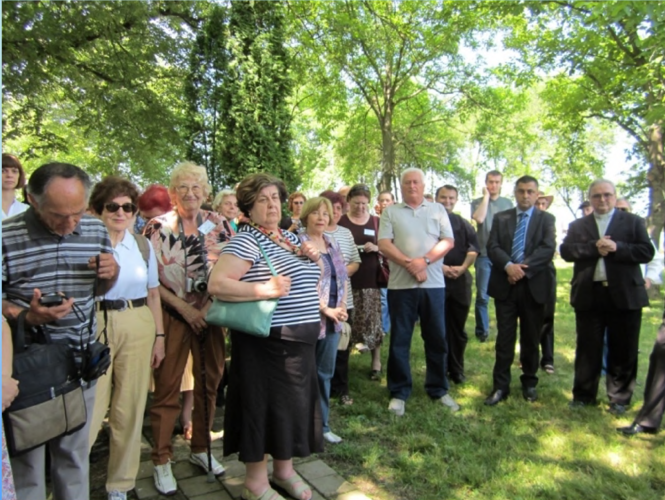
Komemoracija na groblju u Đakovu Učesnici konferencije i preživjeli iz cijele Jugoslavije