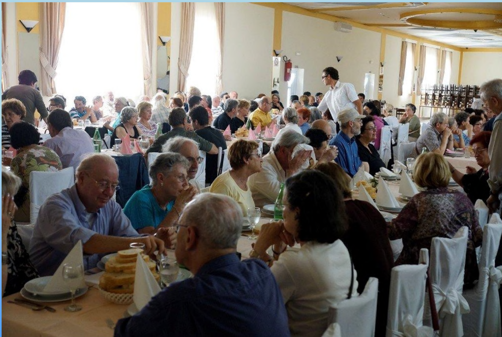
Ručak za učesnike komemoracije na groblju u Đakovu Organizator Židovska općina Osijek