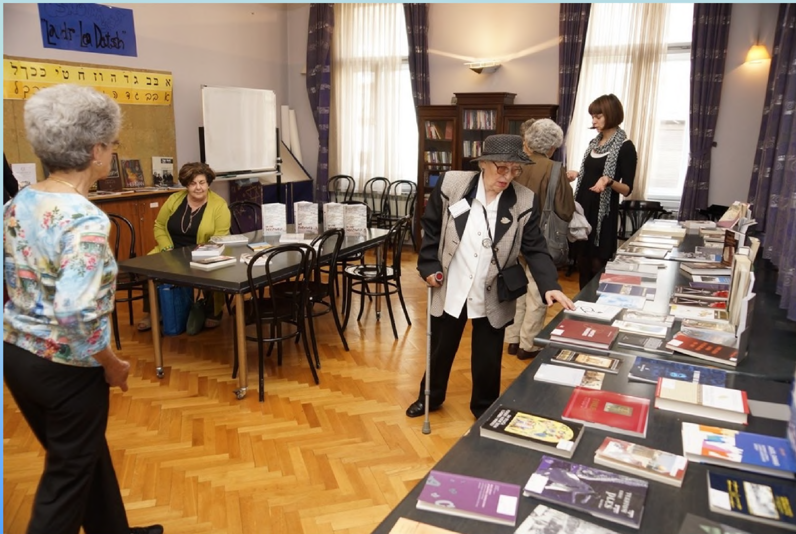
Izložba knjiga i publikacija Židovske općine u Zagrebu