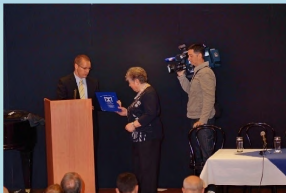
Predaja poklona izraelskog poslanstva - Materijala za edukaciju o Holokaustu