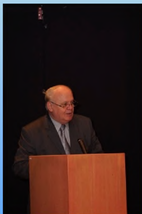
Vladimir Raspudić Poslanik BiH