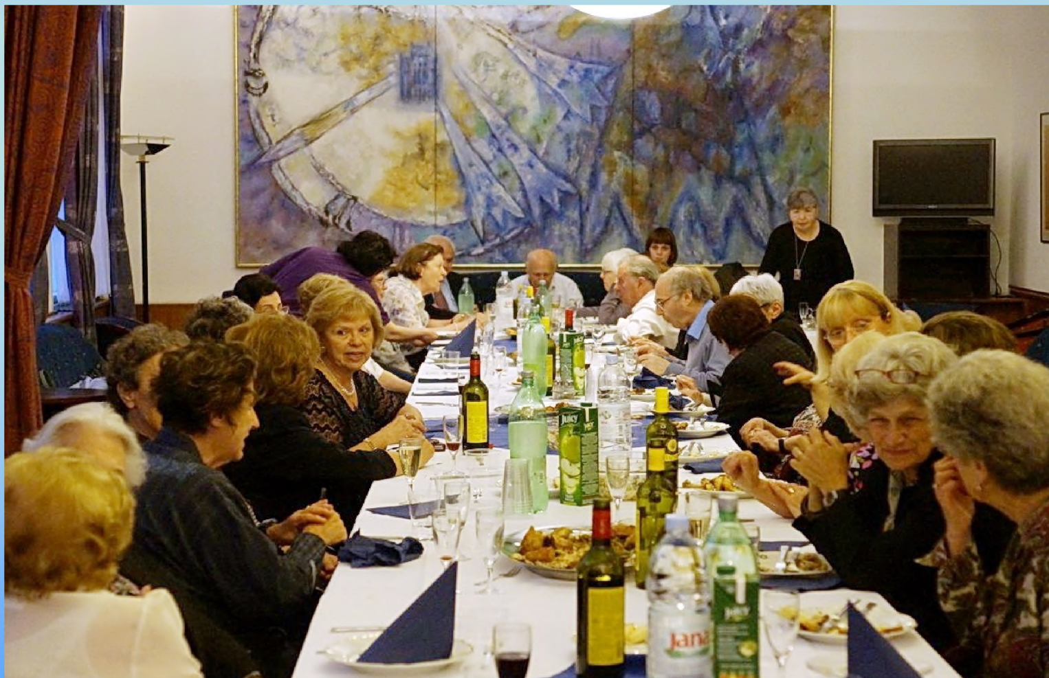
Učesnici konferencije na večeri