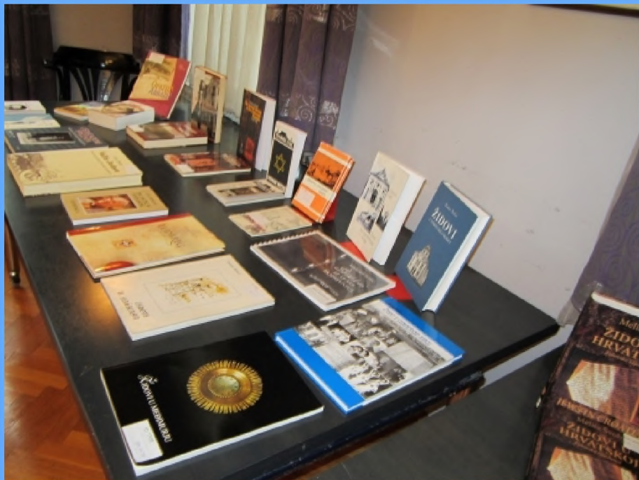
Izložba knjiga, detalj- knjige o židovskim općinama Hrvatske