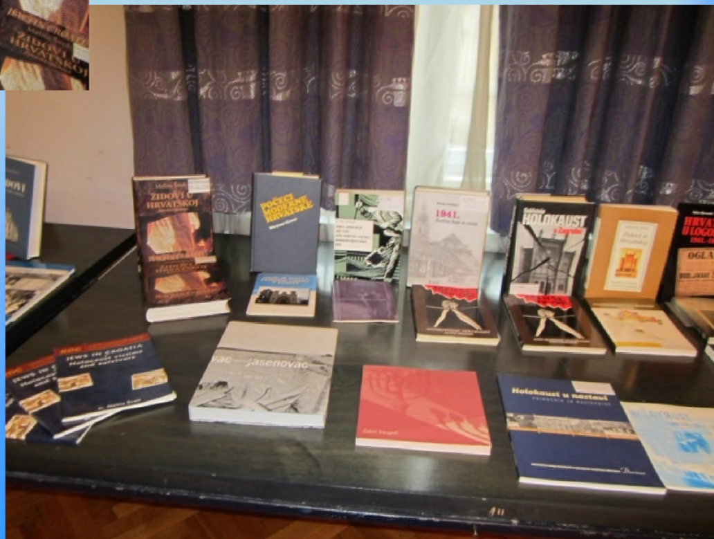
knjige o Holokaustu u Hrvatskoj