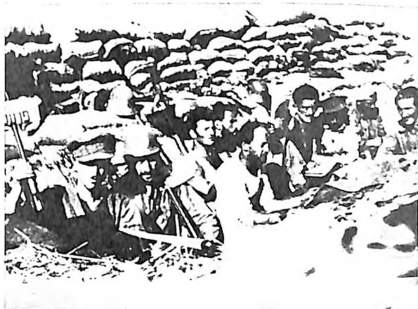
Borci jevrejske čete XIII brigade »Dombrovskog« u bunkerima