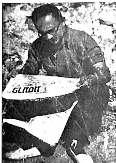
Jedan borac Internacionalnih brigada u Spaniji čita jevrejske novine na jidišu »Prese«