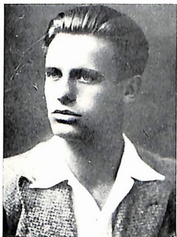
Vladimir Majder Kurt , šef obavestajne službe glavnog štaba Hrvatske. Poginuo 1943. u Lici