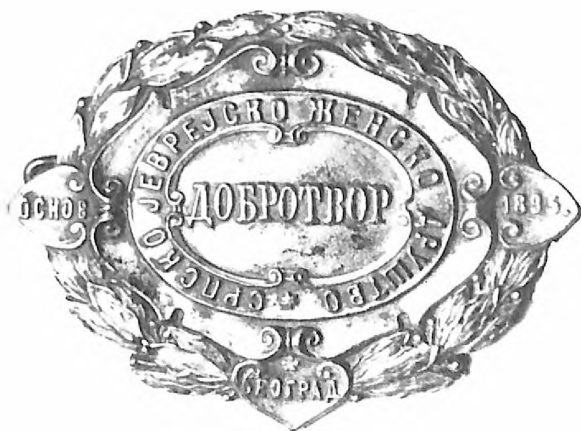
Spomenica Srpsko-jevrejskog ženskog društva "Dobrotvor"