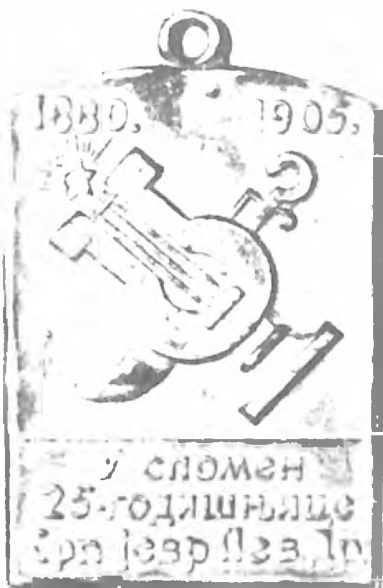
Lice spomenice povodom 25. godišnjice proslave Srpsko-jevrejskog, pevačkog društva