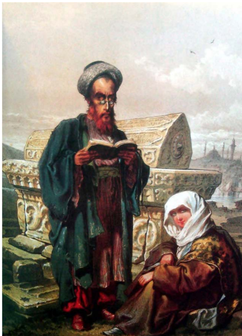
Детаљ са јеврејског гробља