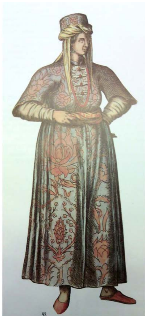
Изглед женске и мушке одеће