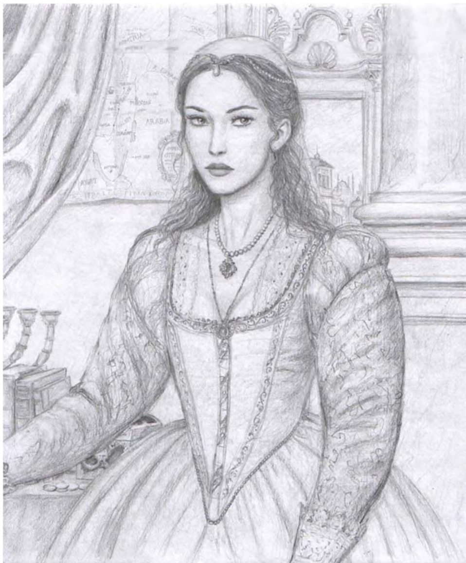
Дона Грација