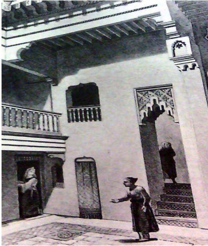
Изглед унутрашњег дворишта јеврејске куће