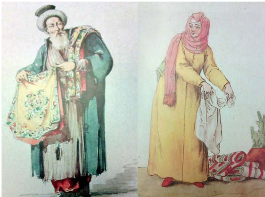
Јеврејски трговци