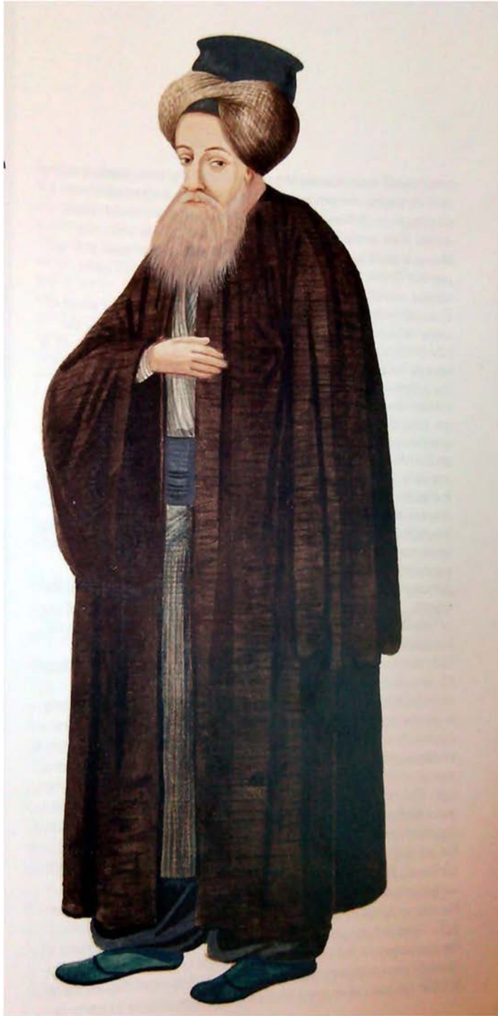
Хахам баши -1790?