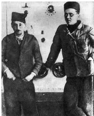
Slika 6: Moša Pijade in Josip Broz – Tito

V luči tako oteženega delovanja je KPJ iskala zaveznike vsepovsod, tudi znotraj judovske skupnosti. Predvsem manj premožne člane skupnosti (delavce, obrtnike, male trgovce in uradnike) in del inteligence je komunistična doktrina pritegovala iz podobnih razlogov kot v Sovjetski zvezi in po Evropi: od daleč so egalitarna stališča, ki jih je obljubljal družbeni prevrat, zagotavljala enakopravnejši položaj. Hkrati se je KPJ zgodaj opredelila proti nekaterim antisemitskim pojavom v mladi državi. Po letu 1923 pa se je angažirala tudi na področju najbolj perečega notranjepolitičnega problema: narodnostnega vprašanja in vprašanja manjšin. 13 Ideološka nadgradnja razrednega bistva revolucije v narodnorazrednega je namreč obetala tudi narodnostno osvoboditev. Kvalitativni preskok je v sebi nosil spoznanje, da imajo narodno čuteče množice za KPJ velik mobilizacijski potencial in so kot take uporabno taktično sredstvo za doseg cilja – revolucije. V to kategorijo je spadala tudi s sionizmom preprejena jugoslovanska judovska skupnost.