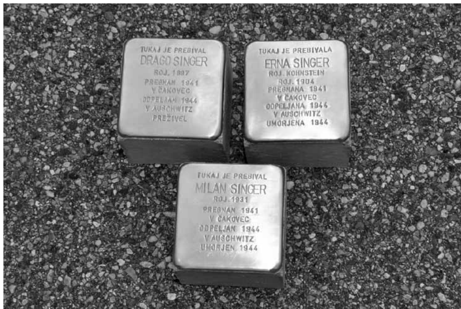
Slika 1: Tlakovci spomina

2012 postavljeni Tlakovci spomina . Akcijo je vodil Center judovske kulturne dediščine Sinagoga Maribor, na svečani zaključni otvoritvi Tlakovcev spomina pa je sodeloval tudi takratni slovenski predsednik dr. Danilo Türk.