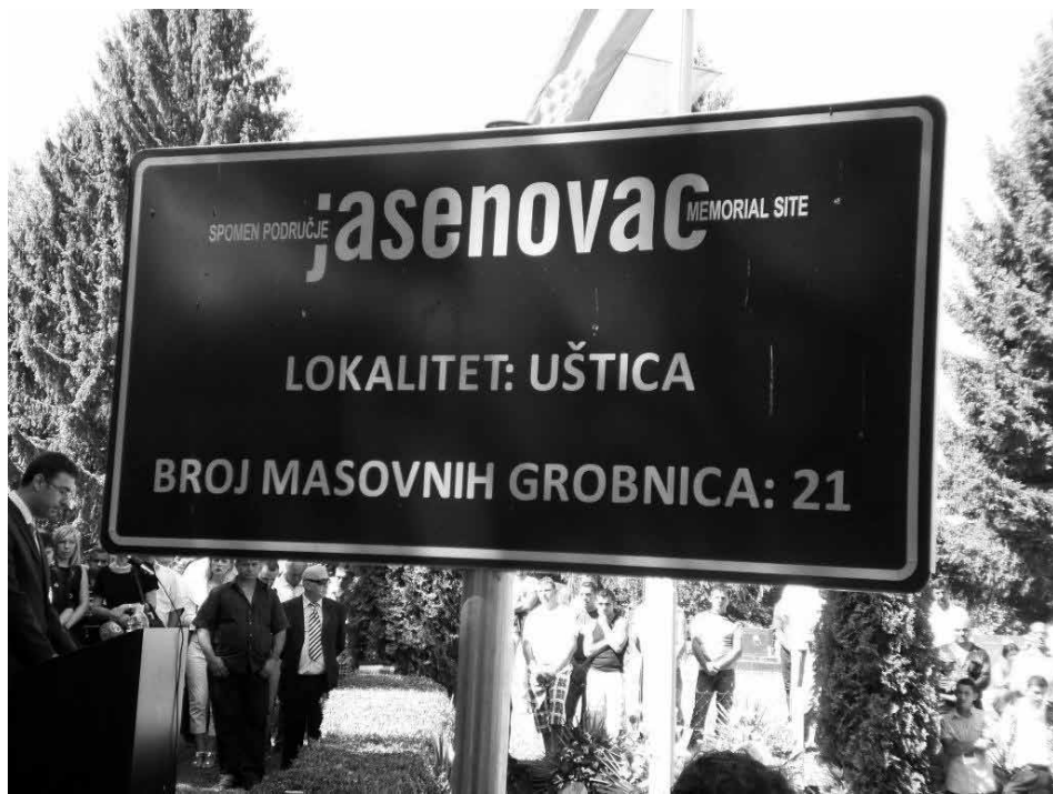
Slika 3: Jasenovac

Preganjanje Romov med drugo svetovno vojno se je stopnjevalo do nacističnih zločinov, katerih cilj je bila končna rešitev, to je popolno uničenje Romov, ki so jih pošiljali v koncentracijska taborišča ali na prisilno delo. Na predlog romskih mednarodnih združenj se na evropski ravni 2. avgust označuje kot mednarodni dan spomina na Rome, žrtve genocida v času nacizma v spomin na dan, ko je bilo v koncentracijskem taborišču Auschwitz-Birkenau (”Zigeunerlager”) umorjeno okoli 3000 Romov v enem dnevu.