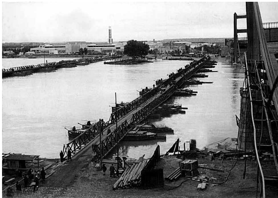
Slika 31: Beograd, maj leta 1941: nemška pontonska mostova čez Savo in porušeni Most kralja Aleksandra, v ozadju Sajmište, ki takrat še ni bilo taborišče.