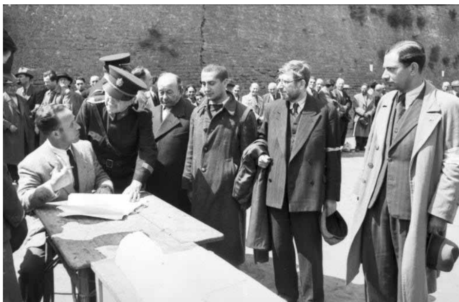
April 1941