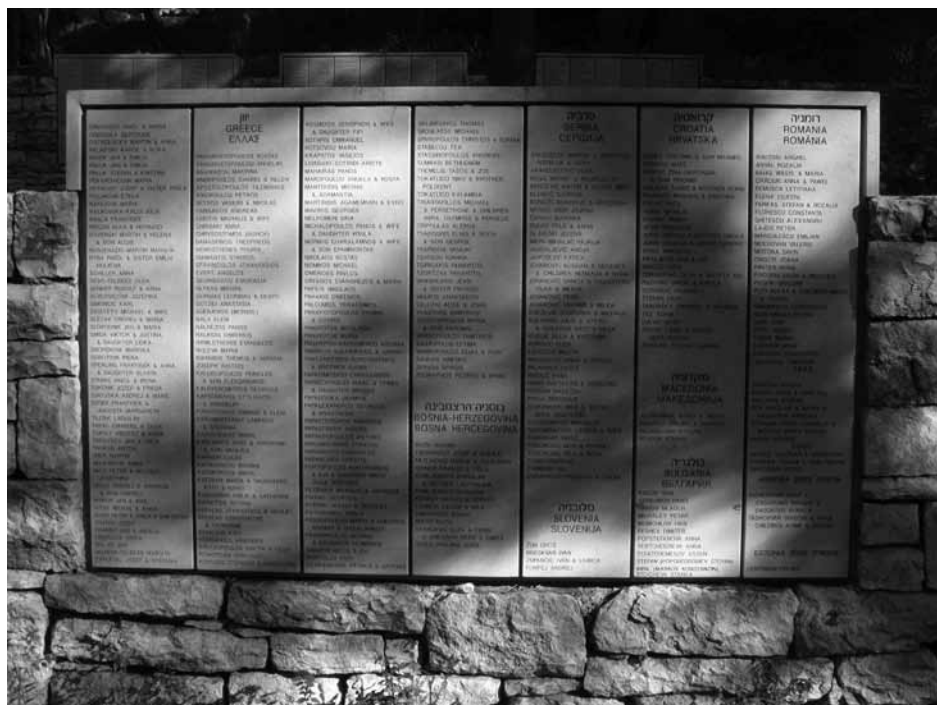
Slika 11: Seznam pravičnikov, Yad Vashem