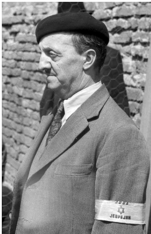
April 1941