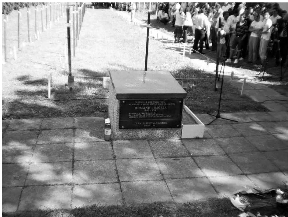
Slika 4: Spominsko obeležje »Romsko pokopališče« v vasi Uštica pri Jasenovcu

Prvič je bila v letu 2012 taka slovesnost organizirana tudi na Hrvaškem, v vasi Uštica pri Jasenovcu, v spomin na več kot 16.000 romskih žrtev koncentracijskega taborišča v Jasenovcu. Slovesnosti ob spomeniku »Romsko groblje« v vasi Uštica pri Jasenovcu so se udeležili politiki in člani diplomatskega zbora, predstavniki Spominskega centra Jasenovac ter Romi iz številnih krajev na Hrvaškem in iz sosednjih držav.