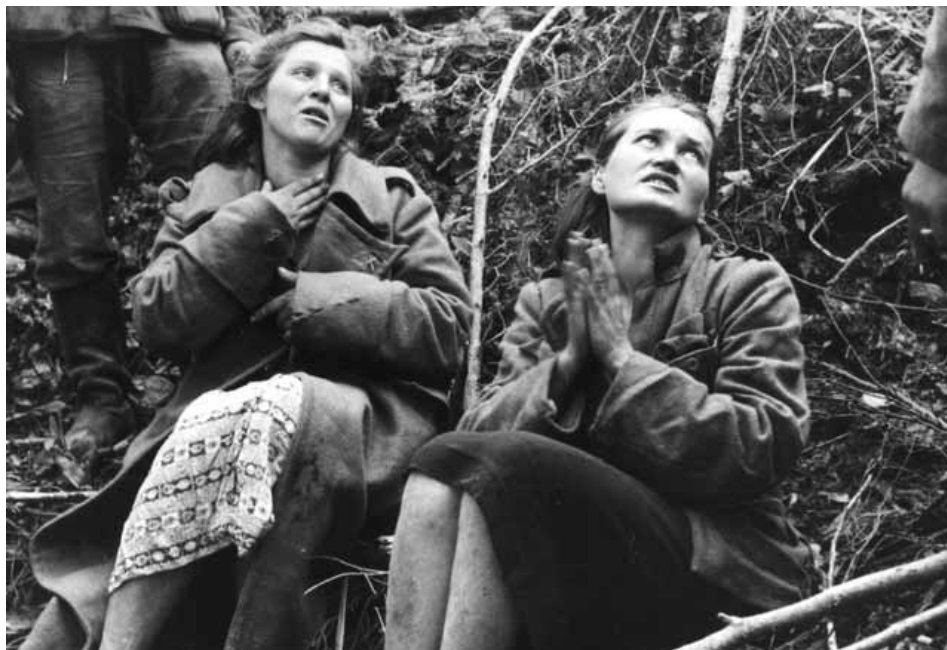
Slika 37: Ženski, morda Judinji, ki so ju zajeli nemški vojaki. Zdi se, da ženski na fotografiji, ki je nastala nekje v Srbiji leta 1941, prosita vojake, naj se ju usmilijo.