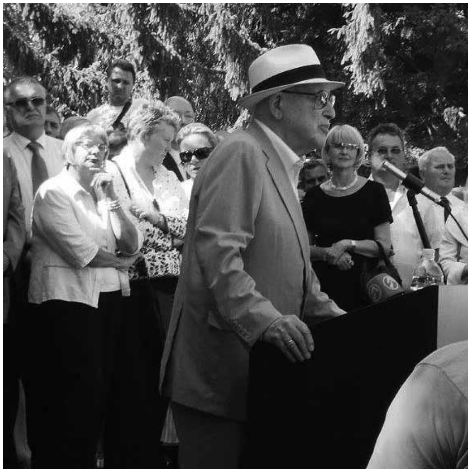
Slika 5: Branko Lustig, govor na spominski slovesnosti v Jasenovcu, 2. 8. 2012

kot jih je videl in doživel kot 12-letni otrok, ko je kot kurir prihajal tudi v romsko taborišče Birkenau. Tam je bilo vedno živahno in mnogo otrok, pred barakami pa se je sušilo raznobarvno perilo. Nekega jutra v začetku avgusta 1944 pa so bila železna vrata pri vhodu v taborišče na stežaj odprta, barake so bile prazne in vse je bilo tiho. V taborišču ni bilo več nikogar, saj so v noči z 2. na 3. avgust 1944 vse Rome usmrtili. 10 Prve zapise o tem zločinu in popolnem uničenju so zapisali Judje iz sosednjega dela taborišča. 11