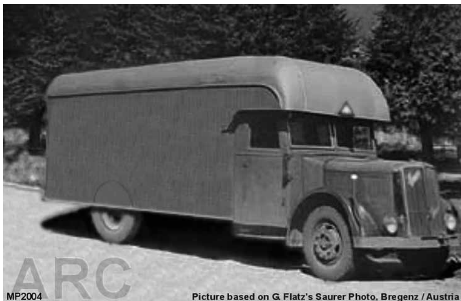
Slika 35: Dušegupka ali Gasmagen , tovornjak Saurer z nosilnostjo 5 ton (ali okoli 70 ljudi), podoben tistemu, ki je deloval v Beogradu med 19. marcem in 10. majem 1942.