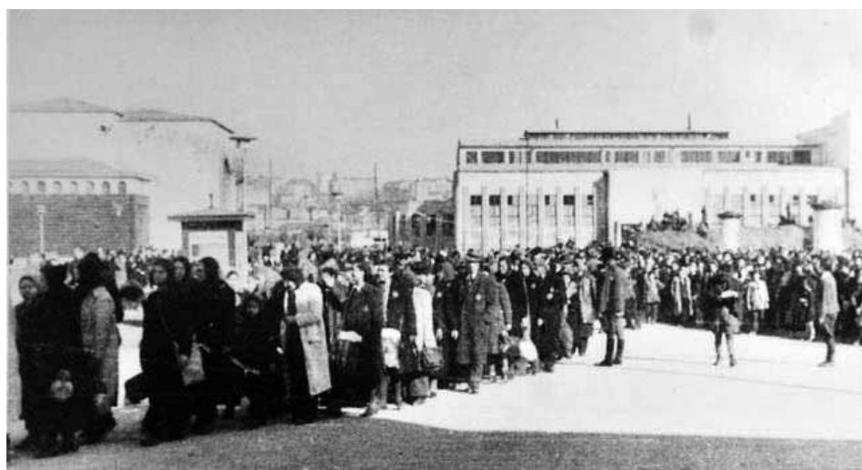
Slika 32: Beograd, december leta 1941: prihod beograjskih Judov v taborišče Sajmište (Semlin Judenlager)