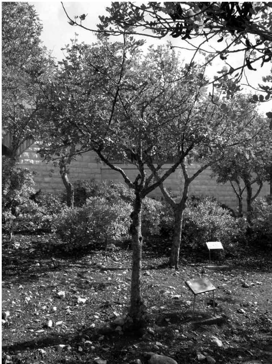
Slika 12: Gozd pravičnikov med narodi