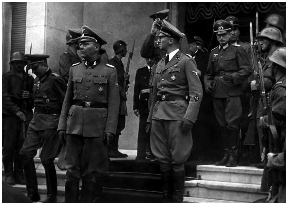
Slika 34: Emanuel Schäfer, poveljnik varnostne policije in SD v Srbiji v letih 1942–1944, ter Bruno Sattler, vodja gestapa v Beogradu v letih 1942–1944, v Beogradu 5. septembra 1943, ko zapuščata veleposlaništvo Bolgarije ob slovesnosti ob smrti carja Borisa.