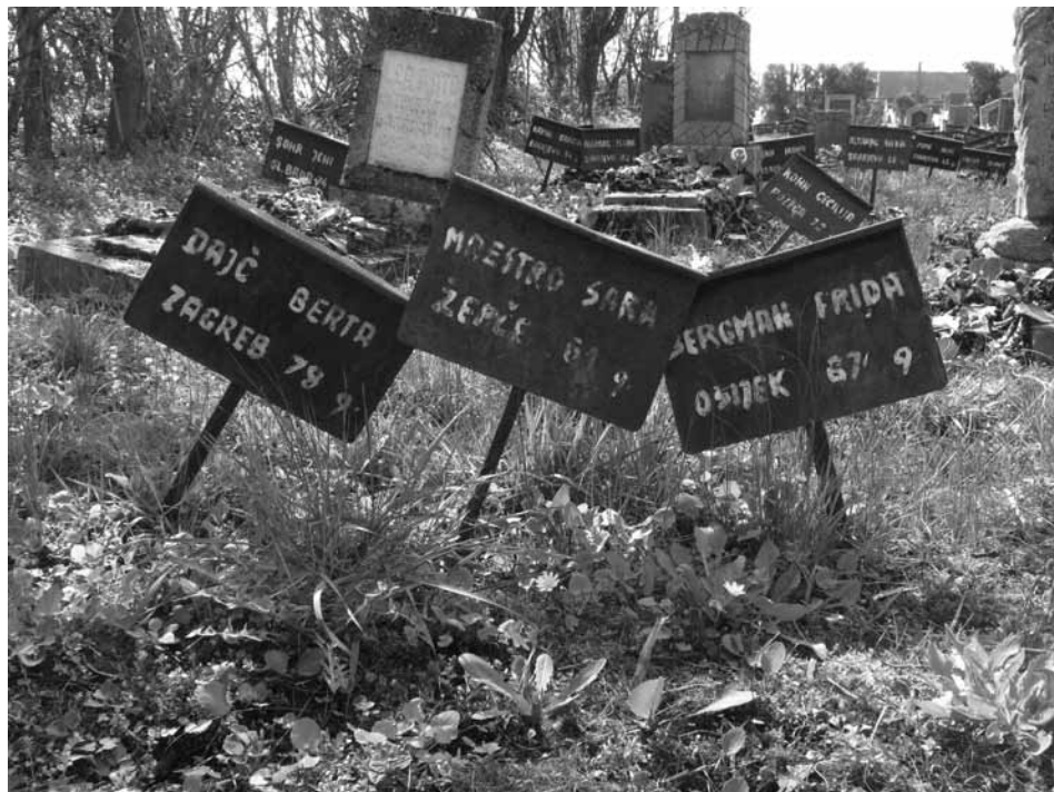
Slika 2: Judovsko pokopališče Đakovo; ploščice, ki označujejo grobove žrtve koncentracijskega taborišča za ženske Đakovo.