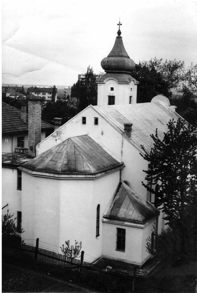
Slika 15: Katoliška cerkev na Čukarici, Beograd