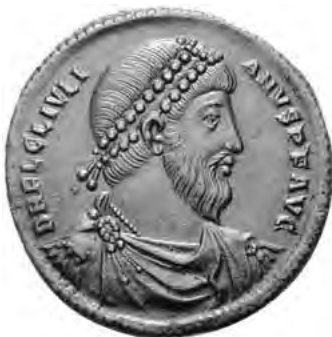
Julijan Flavije Klaudije (332-363)

smrt, povikao je 'O Galilejče, pobedio si!' 4