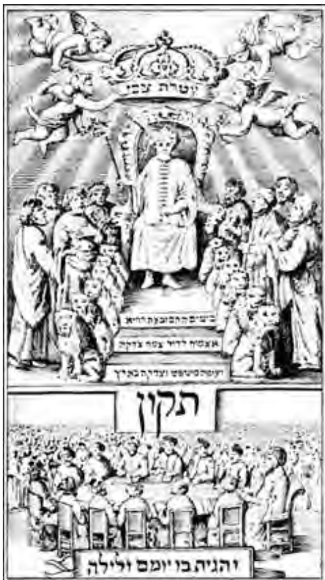
Šabataj Cvij kao krunisani Mesija, Amsterdam 1666.

Javljanje lažnih mesija nakon Bar Kohbe dostiglo je svoj vrhunac u Šabataju Cviju iz Smirne, u sedamnaestom veku. I on je tvrdio da je mesija i to je izneo