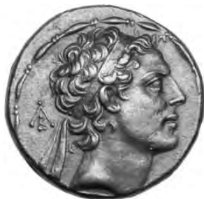
Antioh IV Epifan

Osim toga Antioh je izdao naredbu kojom je zabranio praktikovanje judaizma po cenu smrtne kazne i vršio česte pretrese kuća. Ako bi neko držao subotu, poštovao zakone o hrani, vršio obrezivanje ili bio u posedu svitaka Tore, cela njegova porodica bi bila osuđena na smrt. Odojčad su besili o vrat njihovih majki, a žene bacali sa gradskih zidova. Postojao je samo jedan izlaz, asimilovati se ili umreti. 3