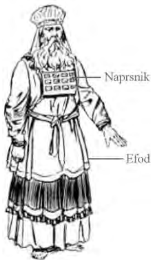
Oplećak (hebr. efod) i naprsnik

Trećeg Hrama! Prvosveštenik će nositi isti efod kakav je nosio i Aron i, naravno, prvosveštenik mora biti iz Aronove loze. A nju nije teško utvrditi. Svi oni koji se prezivaju Koen, Kojen, Kohen ili Kon vode poreklo od Arona, jer upravo njihovo ime znači „sveštenik“.