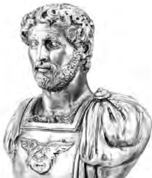
Publije Elije Trajan Hadrijan (76-138)

ali ju je zbog revolta Samarjana, vekovnih neprijatelja Jevreja, brzo povukao.