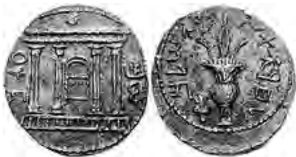
Srebrni šekel Bar Kohbe sa zvezdom iznad Hrama i tekстом "Za slobodu Jerusalima".

Vratimo se nakratko Simonu Bar Kohbi. Njegovo aramejsko ime, koje mu je prema jevrejskoj legendi dao Rabi Akiba, znači Sin Zvezde , što bi trebalo da je ispunjenje mesijanskog proročanstva da će „izaći zvezda iz Jakova“ (4. Mojsijeva 24,17). Međutim, s obzirom da je neslavno završio, odnosno pokazao se kao lažni mesija, u jevrejskoj literaturi su mu promenili ime. „Kohibino pravo ime bilo je Kosiba; skeptici su se rugali tvrdeći da je on Bar Koziba, Sin Laži.“ 33