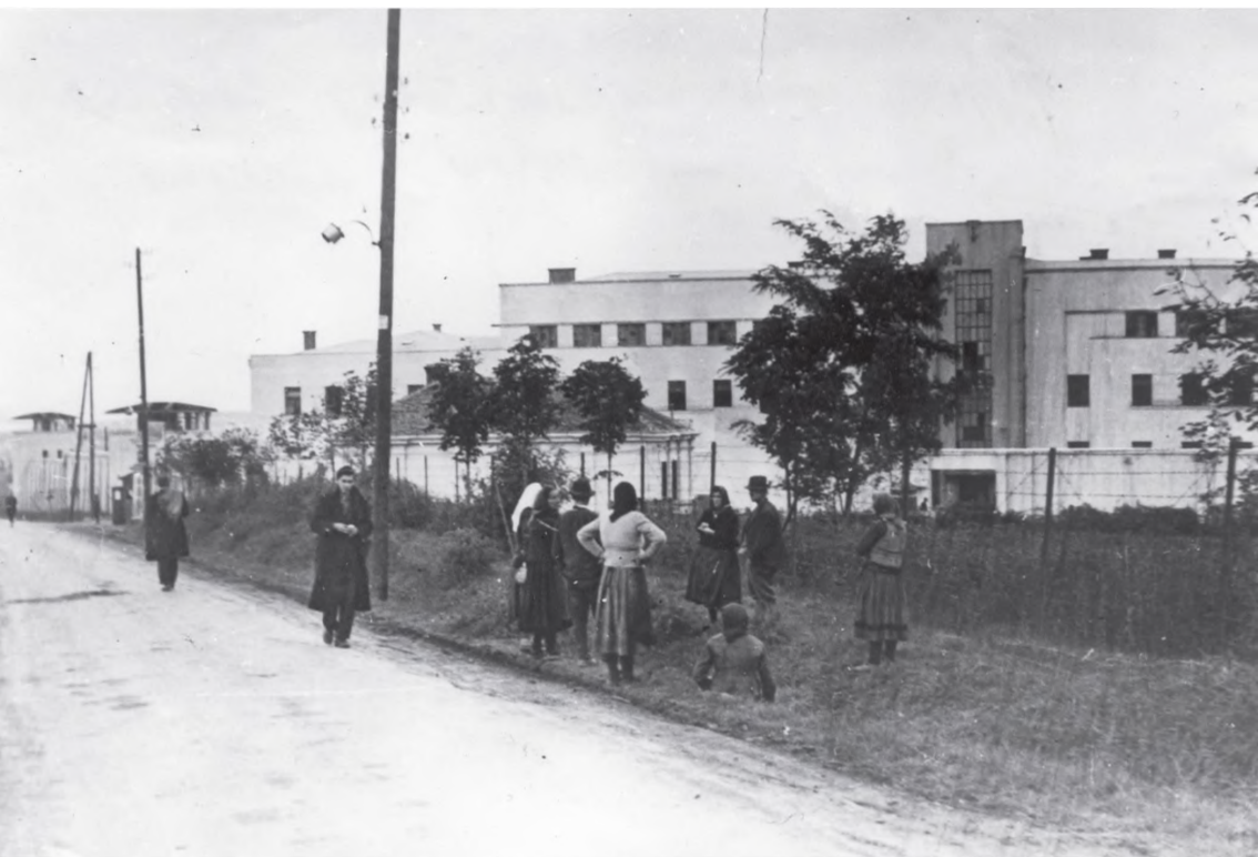
На уласку у Концентрациони логор Београд – Бањича At the entrance to the Belgrade concentration camp – Banjica