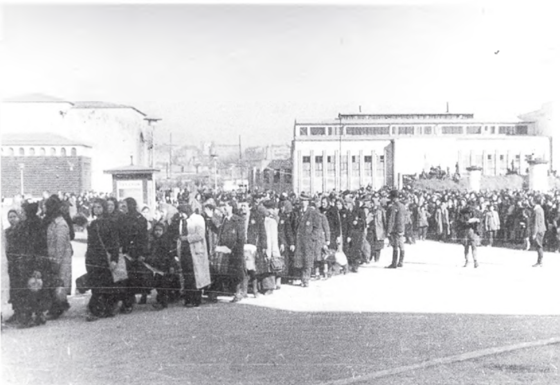
Јевреји у логору Сајмиште (Јеврејски логор Земун) – први дани, 1941, Музеј Војводине Jews at the Sajmište prison camp (Jewish camp Zemun) – first days, 1941, Museum of Vojvodina