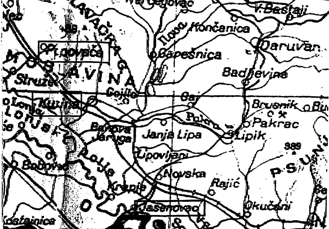
Slika 15. Područje Moslavine i Jasenovca

privrženost prema tim predstavnicima 'starog sveta', jer su ga podsećali na majčine priče o njegovom pradedi, Aharonu Paloti, ortodoksnom rabinu koji je došao iz Mađarske u Zagreb, da bi tamo služio kao rabin od 1809. do 1843. godine. Sve do 1840. zagrebačka jevrejska zajednica je bila ortodokсна i kada je došlo do raskola i uvođenja neološkog pokreta, ortodokсни članovi oko Palote su se odvojili i osnovali zasebnu opštinu. I slikarev deda po majci, Avraham Cvi-Hirš Segal Nojfeld (Avraham Cvi-