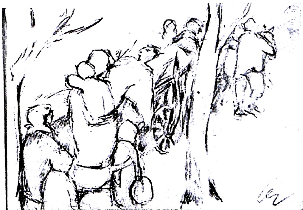
Slika 17. Adolf Vajler, Zbeg, iz notesa za skiciranje, 1941-44?