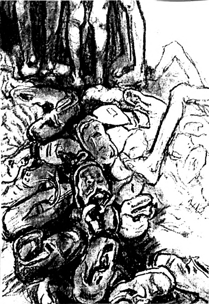
Slika 32. Zinovi Tolkačev, Priprema za 'akciju', 1945

menta, ti radovi su počeli bivati tretirani kao umetnost koja prvenstveno govori o snazi duha i stvaralaštva i u najtežim uslovima. Istovremeno, takva umetnost daje uvid u situacije koje na svojstven način nadopunjuju naše znanje o načinu života i sudbini žrtava, kao i odnosu između žrtve i počini-laca zločina.