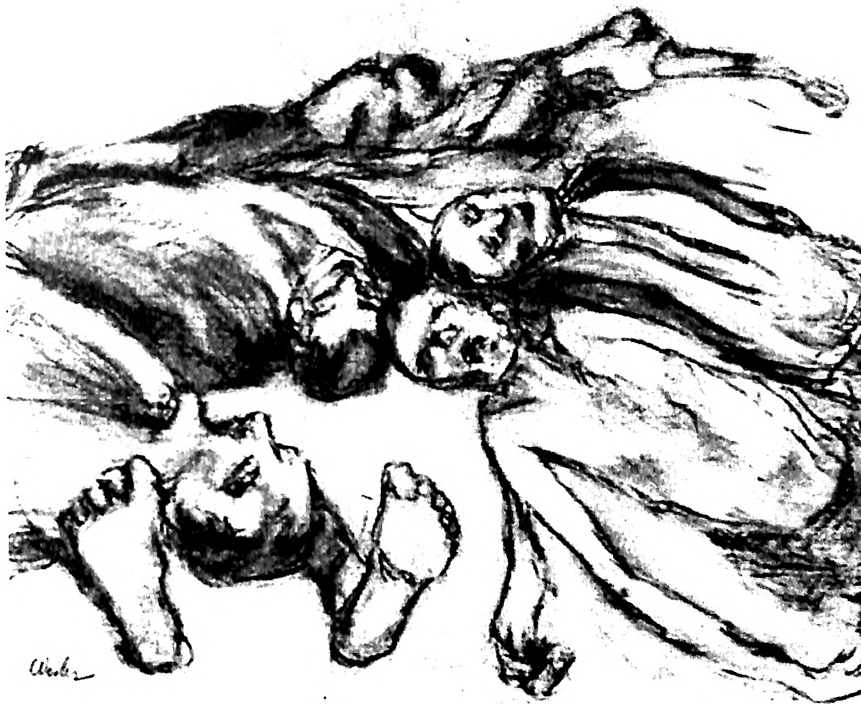
Slika 33. Adolf Vajler, Posle streljanja , 1945-59.

pokretom otpora. Godine 1943. je uhapšen i odveden u zatvor u Kutinu, odakle već nakon deset dana uspeva da pobegne i priključi se partizanima sa kojima ostaje do konca rata, u području Moslavine i Bilogore. 27 No, izgleda da postoji i druga verzija Vajlerove biografije vezane za period rata, po kojoj je slikar bio i u logoru. U tekstu publiciranom povodom smrti Adolfa Vajlera 1969. godine, u beogradskom Jevrejskom pregledu , stoji: