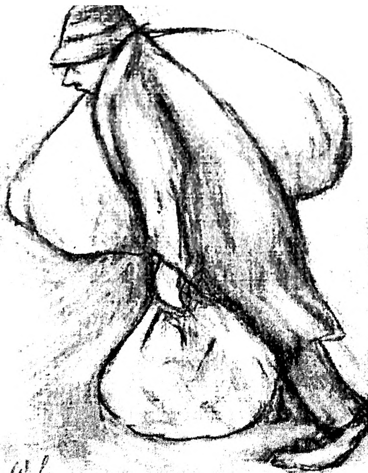
Slika 25. Vajler, Bez oca , 1944-45.