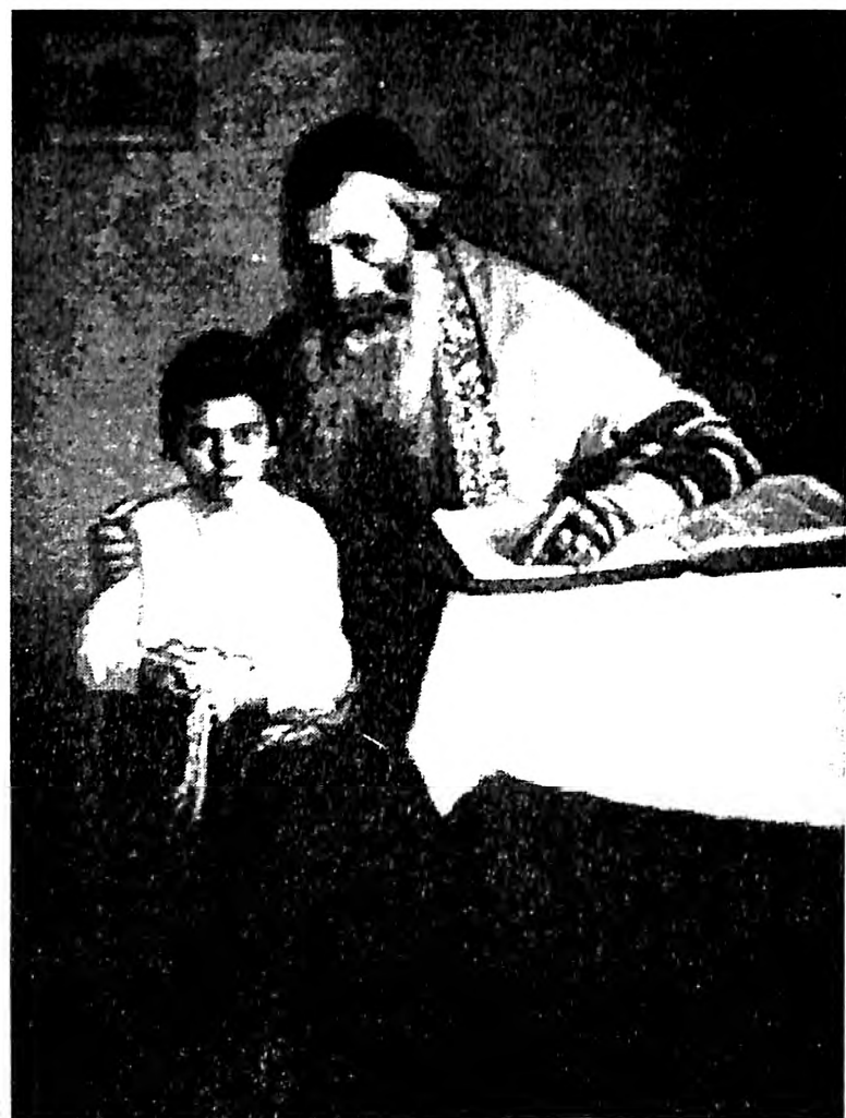
Slika 30. Lazar Krestin, Jutarnja molitva, 1904