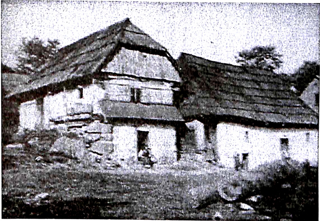
Slika 8. Adolf Vajler, Planinske kuće , fotografija, 1925.

cionistički nastrojene krugove ka daljem podsticanju emigracije u tadašnju otomansku Palestinu. Hiršenbergova slika "Egzil," naknadno prozvana "Dijaspورا" ( Galut ), prikazuje čitavu proteranu jevrejsku zajednicu koja uključuje religiozne Jevreje, jedan od njih nosi Toru , mlađe prosvećene i sekularne Jevreje, prepoznatljive po modernijoj odeći, žene i decu. Oni se kreću u dugoj koloni, u pustoši snegom prekrivenog, nedefinisanog prostora. Ni jedan detalj na slici ne ukazuje odakle su došli i kamo idu, i upravo taj bezvremenski, nedefinisani prostor uzvišuje njihovo lutanje na razinu večnog. Ipak, smer njihovog kretanja na slici – zdesna nalevo, ukoliko se shvati kao geografski smer kretanja, ukazuje na migraciju sa Istoka Evrope na Zapad, aludirajući na stvarne emigracije Jevreja i iseljavanja iz carske Rusije u zemlje zapadne Evrope i Amerike.