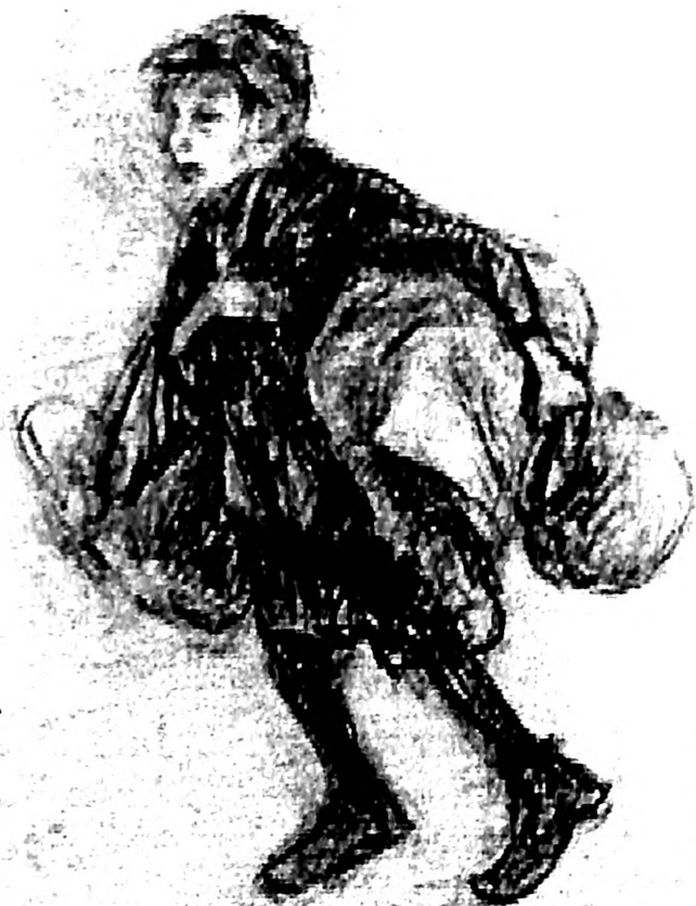
Slika 27. Adolf Vajler, Dete iz zbeга, 1944-45.

magarcem na seoskom putu, iznad prostrane ravnice išarane poljima i lancem planina u pozadini (sl. 11).