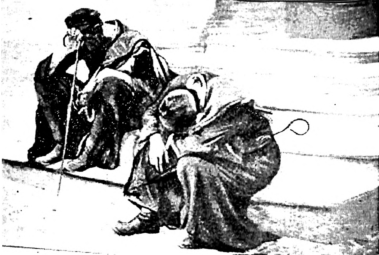
Slika 7. Leopold Pilihovksi, Umorni , Ost und Vest , 1902

je pripadao, podsticao njen razvoj. 6 Za vreme V. cionističkog kongresa u Bazelu, decembra 1901, on je organizovao prvu izložbu jevrejske moderne umetnosti. Istovremeno, kao jedan od urednika jevrejsko-nemačkog časopisa Ost und West (Istok i Zapad), koji je izlazio u Berlinu od 1901. do 1920., Buber je promovisao jevrejske umetnike i umetnost, posvećujući im pažnju u tekstovima, kritikama i reprodukcijama, publikovanim skoro u svakom broju. No, za razliku od Openhajmovog idelaističkog stava, početak dvadesetog veka je u umetnosti jevrejskih slikara, naročito onih iz centralne i istočne Evrope, bio označen znatno kritičkijim stavom. Siromaštvo, rezultati pogroma u carskoj Rusiji, emigracija i izbeglice postaju česta tema koja ukazuje na nerešeno pitanje "jevrejskog problema." Za primer može poslužiti slika poljsko-jevrejskog umetnika Samuela Hiršenbergova "Egzil" iz 1904. godine, 7 kojom je reagovao na krvavi pogrom u Kišinjevu. Taj pogrom, koji se odigrao godinu dana pre Hiršenbergove slike, zahvaljujući fotografijama masakriranih i ubijenih žrtava publikovanim u zapadnoevropskoj jevrejskoj štampi, je izazvao zaprepaštenje i potaknuo