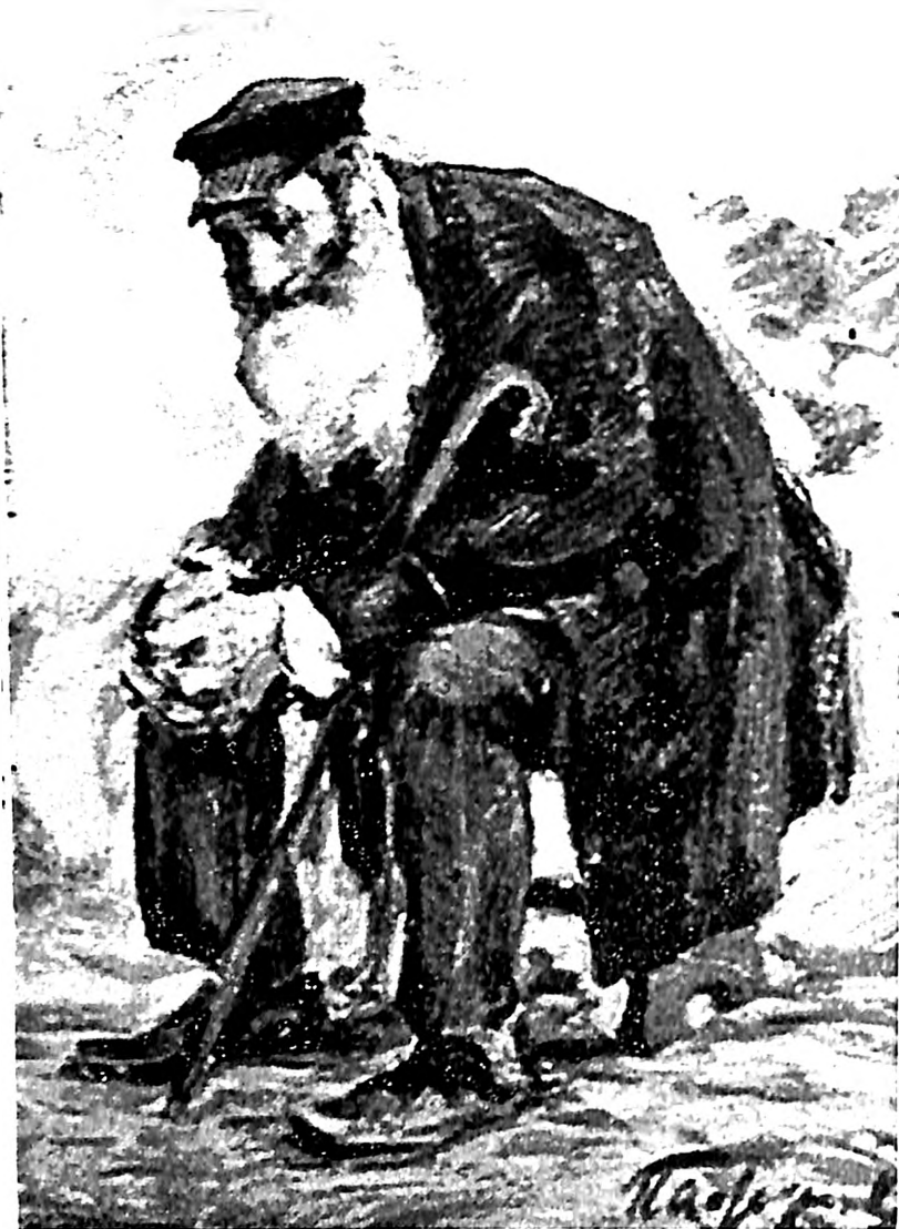
Slika 22. Leonid Pasternak, On može da čeka (ili Kamo?) , 1891

vim čestim boravcima u Bosni, lik njegovog starog Jevrejina pre podseća na stare jemenićanske Jevreje u Jerusalimu pored Zida plača, kako ih je portretisao Samuel Hiršenberg (sl. 6), nego na lokalnog Sefarda. Hiršenberg je 1907. iselio iz rodne Poljske u Palestinu i predavao umetnost na novoosnovanoj jerusalimskoj umetničkoj školi "Becalel" koja je za cilj imala obnovu jevrejske umetnosti. Uzimajući za modele orijentalne tipove – jemenićanske Jevreje, Beduine i Arape, jevrejski umetnici koji su u Jerusalim počeli pristizati početkom XX veka, uglavnom iz istočne Evrope, pokušali su stvoriti novi autentični lik za svoje biblijske scene koji će se razlikovati od hrišćanske ikonografije. Vajlerov "Sefardski Jevrejin", kao i Hiršenbergovi likovi orijentalnih Jevreja, može da se na taj način razume i kao rezultat cionističke ideologije koja je upravo na Orijentu tražila rešenje tegoba života u Dijaspori. Istovremeno, njegov "Prosjak" (sl. 5) kao