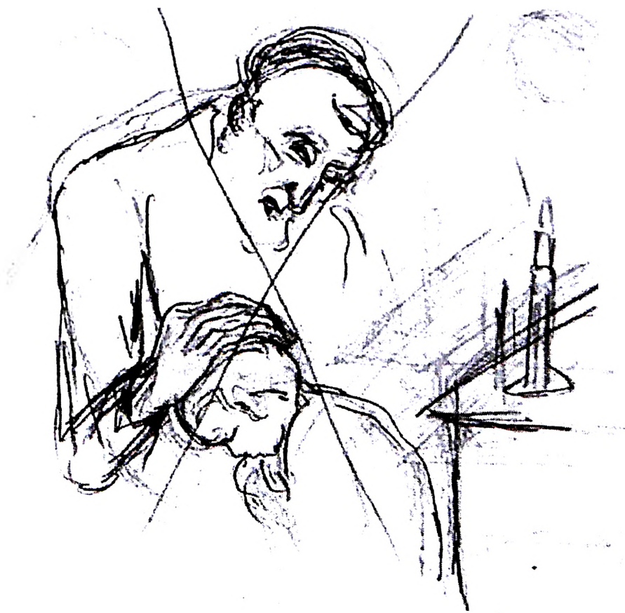
Slika 19. Blagoslov , 1944-45.

Izborom upravo istočnoevropskih religioznih Jevreja za motive svojih slika, Vajler je s jedne strane nastavljao dakle porodičnu tradiciju – sećanja na religiozan način života pradede rabina i umetničku nadarenost dede rukotvorca. No, istovremeno, kao sekularan Jevrejin blizak cionističkim krugovima, Vajler je najverovatnije bio upoznat sa potrebom za modernom jevrejskom nacionalnom umetnošću koju je propagirao cionistički pokret i koja je već od početka 20. veka počela da se pojavljuje reprodukovana u cionističkim jevrejskim časopisima, kao Ost und West . Upravo likovi starih napaćenih Jevreja dijaspore, kao što smo ranije videli, trebali su poslužiti novoj ideologiji kao podstrek za promenu i traženja teritorijalnih rešenja koja bi oslobodila “izabrani narod” večitog lutanja, prisilnih iseljavanja i nepripadanja.