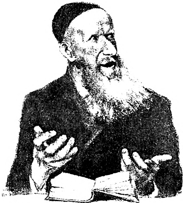
Slika 2. Adolf Vajler, Rabin, 1922-23

kako moderne evropske jevrejske umetnosti, tako i umetnosti u vezi sa periodom holokausta.