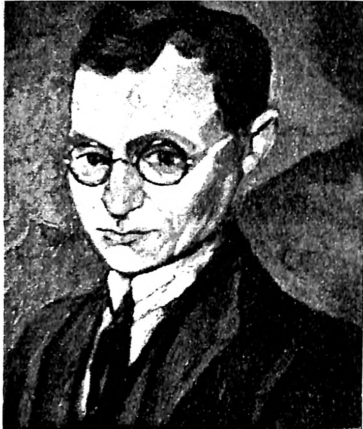
Slika 1. Adolf Vajler, Autoportret , Minhen, 1923, ulje na platnu, privatna kolekcija, Beograd

„antifašističke koalicije, odnosno poraza nacizma, fašizma i ustaštva” kojeg je Židovska općina Zagreb sprovela 1995. godine. 2