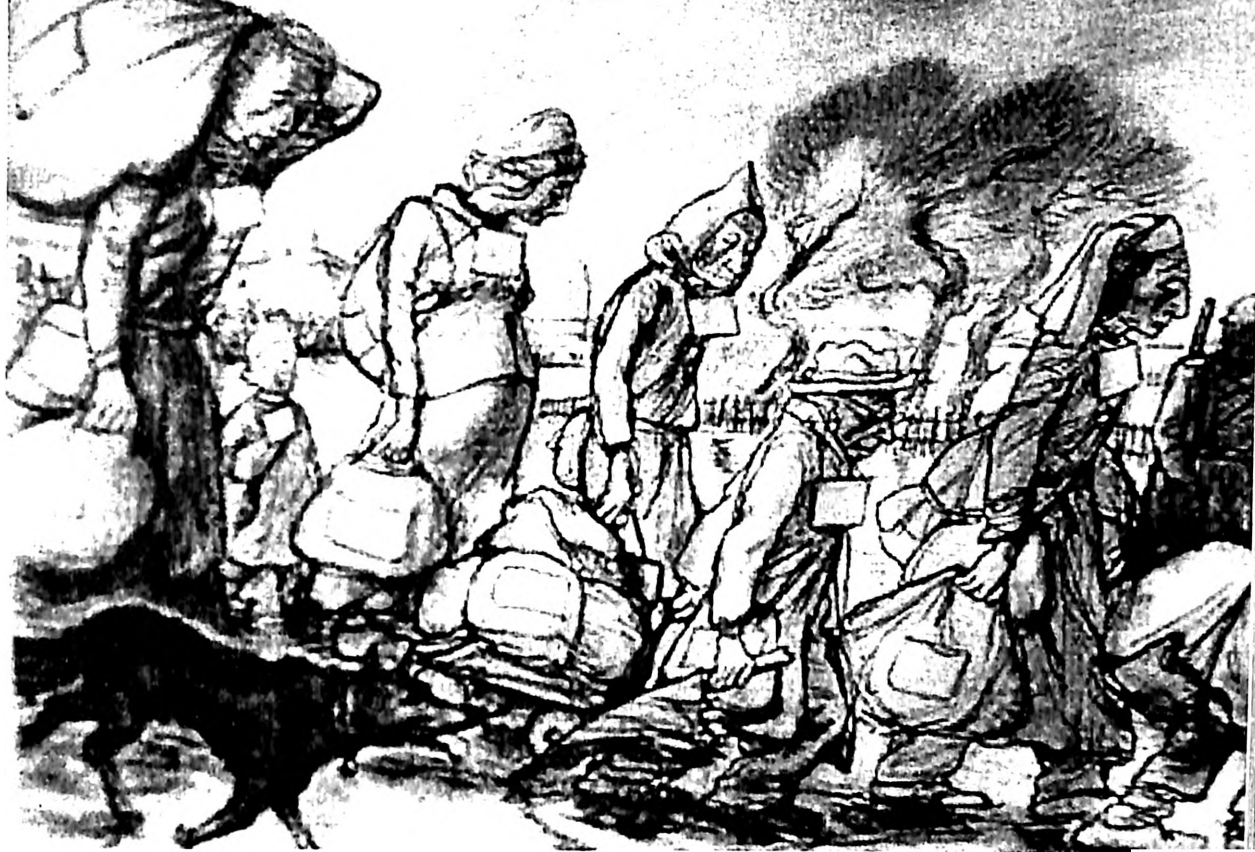
Slika 14. Leo Has, Transport na istok, Terezijenštat, oko 1942

Tu bi proboravio po čitave dane promatrajući starce i njihove polaznike, slušajući njihovo pričanje, upuštajući se s njima u razgovor, promatrajući i studirajući njihove kretnje i izražaj lica. 14