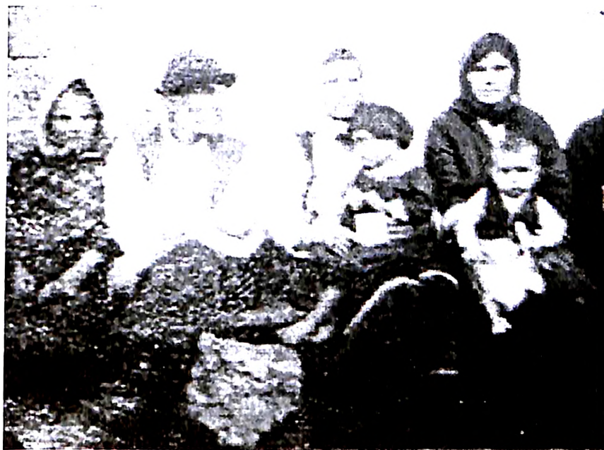
Slika 10. Adolf Vajler, Porodica drvosječe, fotografija, 1925

bili reprodukovani na razglednicama štampanim u Beču i Berlinu, i tako poznati širokoj jevrejskoj publici, pa verovatno i samom Vajleru. 10