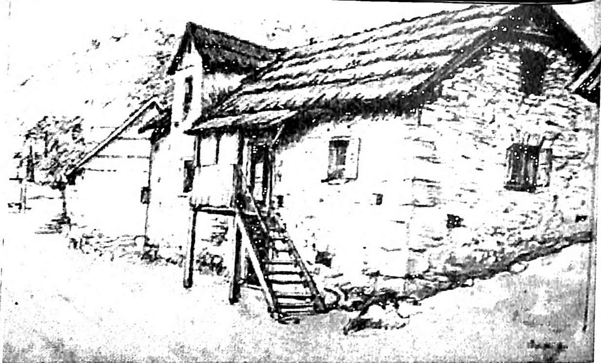
Slika 9. Adolf Vajler, Planinske kuće , 1925.

avgusta te godine. Izložba je popratila jevrejski omladinski slet i bila prikazana u zagrebačkom jevrejskom listu Židov . 8 Vera Štajn, pisac sažetog prikaza izložbe, pominje Vajlera kao autora nekolicine ulja, malih formata, koji kao glavni motiv imaju istočnoevropske tipove Jevreja ( Ostjuden ) koje je prikazao sa naglaskom na karakteristične pokrete ruku i izraze lica. Nažalost ti se radovi nisu sačuvali niti su bili reprodukovani u tekstu prikaza izložbe, tako da je taj kratak opis jedini izvor informacije o Vajlerovim najranijim radovima. Ipak pominjanje upravo istočnoevropskih Jevreja, kao teme koja ga je tada interesovala, interesantno je i ukazuje na Vajlerovo poznavanje takve slikarske tematike koja je bila rasprostarnjena u centralnoj (Austrija, Mađarska) i istočnoj Evropi (Galicija, Poljska, Rusija). Moguće je da je dve godine kasnije publikovana crno-bela reprodukcija rada, upravo primer tih ranih radova izloženih u Zagrebu, 1922 (sl. 4) 9 . Vajlerov "Rabin," poznat isključivo iz navedene publikacije, ukazuje na njegovo poznavanje radova takvih jevrejskih umetnika kao što su Lazar Krestin (Kovno, 1868 – Beč, 1938) ili Leopold Pilihovski (Pila, Poljska 1869 – London, 1933), čije slike oslikavaju istočnoevropski jevrejski ambijent vezan za učenje Tore i molitvu (sl. 3). Njihovi radovi su često