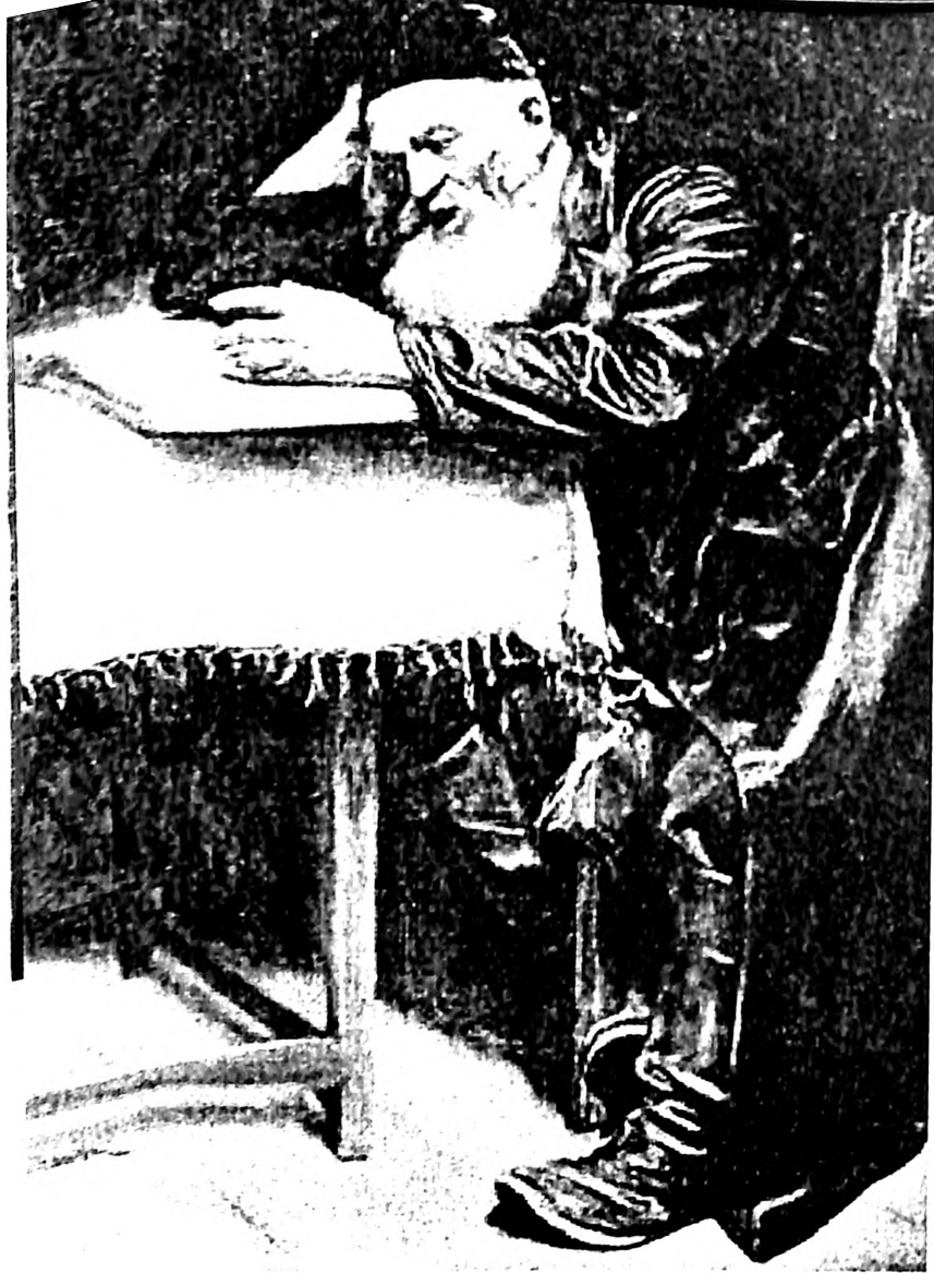
Slika 3. Leopold Pilihowsky, Za Talmudom , razglednica, oko 1902

običaja. Istovremeno, uz stvaranje snažnog, ujedinjenog Nemačkog Carstva, prvenstveno pod kancelarom Otom fon Bizmarkom, koje je bilo popraćeno pojavama izraženog nacionalizma – rasni anti-semitizam počinje da se pojavljuje kao „druga strana medalje.” Podstaknut tim procesima i pojavama, Openhajn, u periodu od 1866. do 1880. kreira seriju slika posvećenih „Scenama iz života jevrejske tradicionalne porodice.” Slike su bile istovremeno reprodukovane u crno-belom tehnici i uz popratne tekstove koje je napisao frankfurtski liberalno nastrojen rabin, dr Lepold Štajn (Leopold Stein, 1810-1882), publikovane u vidu albuma. Album je bio podeljen u tri dela – na scene u vezi sa slavljenjem Sabata (subote) i jevrejskih praznika; scene u vezi sa životnim ciklusom Jevrejina (obrezanje, prvo donošenje deteta u sinagogu, učenje u hederu , bar micva , venčanje i