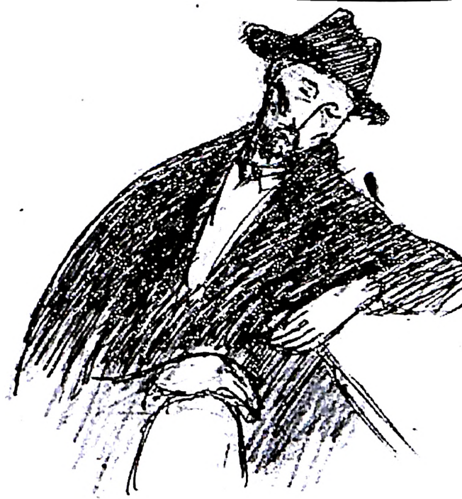
Slika 16. Adolf Vajler, Lik Jevrejina, iz notesa za skiciranje, 1941-44?