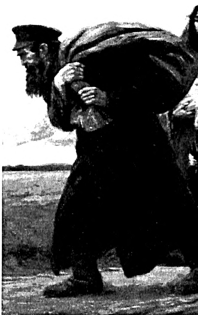
Slika 23. Maks Fabijan, Ahasver (Jevrejin lotalica) , 1902.

da upravo predstavlja te tegobe i moguće ga je uporediti sa nizom slika umornih i napaćenih Jevreja koje se javljaju kao reprodukcije u časopisu Ost und Vest ili na razglednicama (sl. 7).