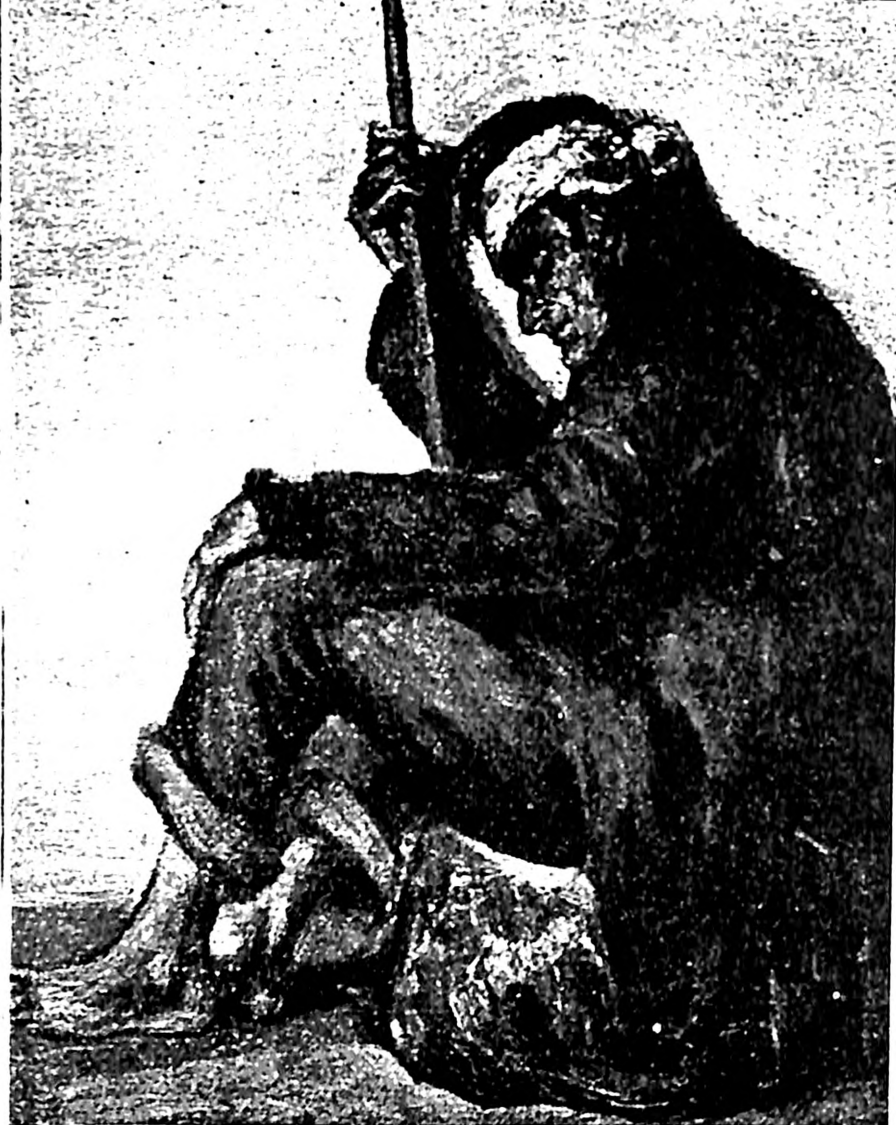
Slika 5. Adolf Vajler, Prosjak , 1923-24.

praznika Sukot može da posluži kao primer takvog stava 5 : jevrejska porodica proslavlja praznik na tradicionalan način, sedeći u suki koju su podigli, nastavljajući tako običaj predaka, no suka je otvorena i ne-jevrejska deca, koja se vraćaju iz škole (jer njima nije praznik) mogu slobodno da vire unutra. Oni time simbolično pozivaju ne-jevrejskog posmatrača slike da gleda zajedno sa njima i uveri se da je obred koji se obavlja unutar suke civilizovan i da se jevrejska porodica po svom izgledu ne razlikuje toliko od ne-jevrejske porodice. Openhajn je čak uspostavio sličnost između lika oca koji sedi za stolom u suki , blagosilja vino držeći kiddush pehar u ruci dok je pokrivena halla na tanjiru pred njim, sa likom Hrista. Tome doprinosi i aura svetla koja okružuje oca porodice a dopire sa svetiljke, tzv. Judensterna – svetiljke korištene u jevrejskim kućama za Šabat i praznike od srednjeg veka. Konačno, građanski karakter porodice naglašen je pri-