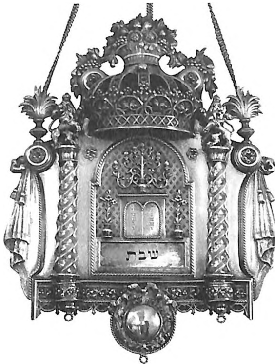
Tora-Schild München 1865. Gross Familie Kolektion

Raspored izlaganja po poglavljima i odabranim predmetima je samo nalik na prošireni izložbeni katalog. Služeći se razbijenom predstavom Jevrejstva, pogotovo na tlu Nemačke, autorka Hajman-Jelinek odgovorila je zadatku naknadne post-muzeološke pretrage fragmenata. Umnogome se otud i izložbena postavka u Jevrejskom muzeju Minhena, kao i udaljavanje od bilo kakve totalizujuće slike materijalnih ostataka, pokazuje u drukčije osnaženoj predstavi. Postupak je na tragu praćenja koja su, po svoj prilici, u humanistici i u oblasti kulturnog pamćenja pionirski i sa etičkom odgovornošću postavili naučnički i supružnički par istraživača, profesori Alaida i Jan Asman, čije su knjige poput „Duge senke prošlosti” i „Kulture pamćenja” objavljene i na srpskom jeziku, gde je ukupna antropološka dimenzija tranzitornosti jevrejskih verskih rituala dovedena u nov poredak.