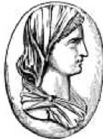
Markion od Sinope

„Teološki supersesionizam, kojeg posebno ima u evropskom protestantizmu, nameće ideju da je Novi zavet zamenio Stari. Dalje, milost je zamenila zakon, a duhovni Bog spasenja u Novom zavetu zamenio je telesnog Boga stvaranja u Starom. Nedelja, proslava spiritualnog oslobođenja od zla prirode i tela, zamenila je sedmi dan šabat, biblijsku ustanovu slavljenja stvaranja. Dok ova shvatanja imaju svoje poreklo u jeresi Markiona u drugom veku, ona i dalje postoje u tradicionalnom hrišćanskom mišljenju.“ Jacques B. Doukhan: The Mystery of Israel, Review and Herald Pub. Assn., Hagerstown 2004, str. 12.