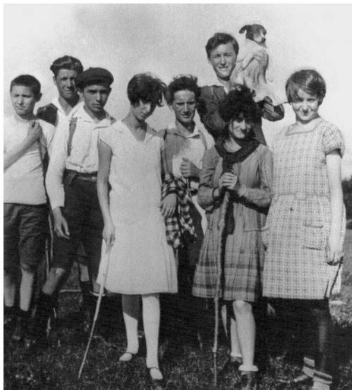
Slika 2: Skupina mladih goriških sionistov na izletu, pred drugo svetovno vojno.