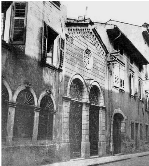
Slika 1: Sinagoga v nekdanjem goriškem getu, tik pred drugo svetovno vojno. Hrani muzej sinagoga v Gorici.