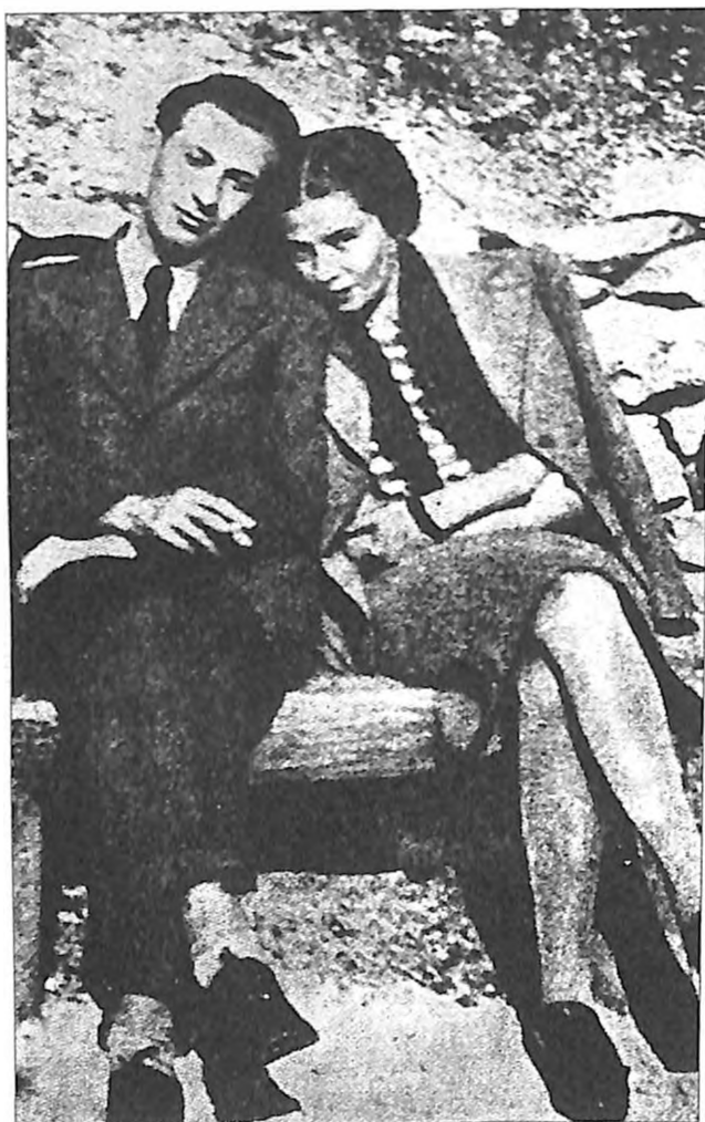
Mađarski pesnik Mikloš Radnoti sa suprugom pre interniranja

Bor su 3. oktobra 1944. oslobodile jedinice 23. srpske divizije NOVJ. Grupa od oko dvesta logoraša koja se nije povukla sa drugom grupom, sastavljena od bolesnika i iznemoglih logoraša, sa magacinom i malim brojem vojnika stražara je oslobođena toga dana. Bivšim logorašima su obezbeđeni smeštaj i ishrana, a oficiri i vojnici mađarske straže su zarobljeni. Među oficirima iz druge grupe našla se i nekolicina oficira sa kapetanom Belom Nađom i po zlu čuvenim Časarom. Jedan broj oslobođenih logoraša stupio je u NOVJ.