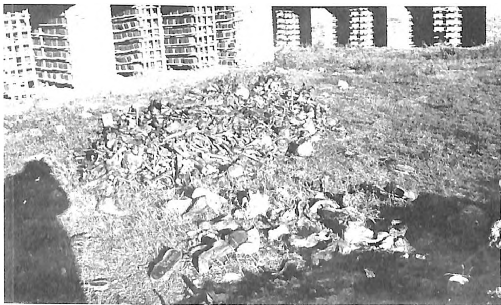
Posmrtni ostaci ubijenih u Crvenki ekshumirani su posle rata i preneti u zajedničku grobnicu na Jevrejskom groblju u Somboru

Bor 17. septembra 1944. godine. Do Smedereva se sve odvijalo u najboljem redu, a tada je pala prva žrtva. Kako je zapisano u dokumentima, folksdojčeri su kod Pančeva ubili osam, kod Jabuke 146, a u Perlezu 250 Jevreja logoraša. Na teritoriji Bačke pobegla je nekolicina zatočenika; njih 20 se sakrilo u podrumu novosadske bolnice. U Srbobranu je ubijeno 20, u Vrbasu 10, a u Crvenki je u oktobru 1944. ubijeno 680 logoraša. Iz zajedničke grobnice izvukla su se dvojica: Vilim Potesman iz Subotice i Đerđ Laufer. Ubijanje je nastavljeno; tako je u Somboru ubijeno 40, u Bačkom Monoštoru 26, do Bezdana još 10, zatim novih 50, u Baji sedmorica logoraša, a ubijali su ih nemački i mađarski vojnici. U selu Abdi ubijen je još 21 logoraš, a među njima i čuveni mađarski pesnik dr Mikloš Radnoti. Od cele grupe je ostalo oko 1 500 logoraša koji su sprovedeni u logore u Nemačkoj. U Jugoslaviji je posle rata živelo oko 20 bivših logoraša iz Bora.