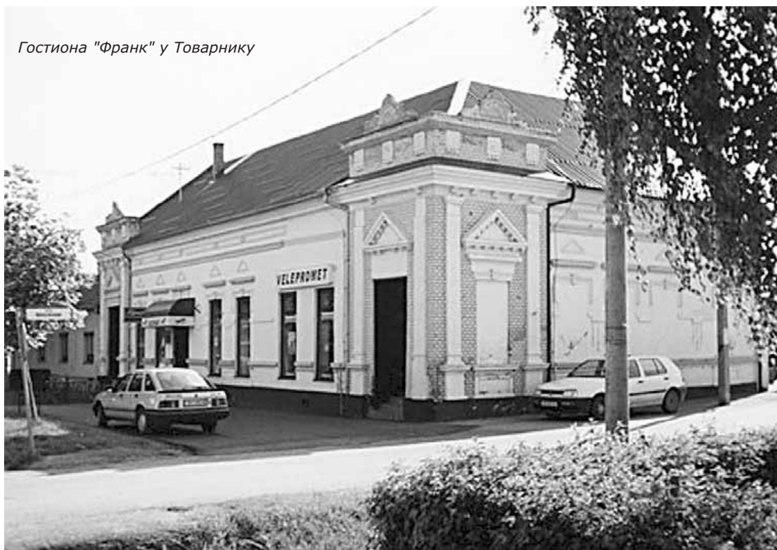
Гостиона "Франк" у Товарнику

Све док 1893. године није пуштена у рад пруга на деоници Винковци – Сремска Митровица, роба за ову кућу је довозена лађом до Вуковара или железницом до Винковаца, а одатле колима у Товарник. Када је успостављен железнички саобраћај и на овој деоници, роба је стизала на станицу Товарник, одакле се превозила до магацина. Током најпрометнијих година, свакога дана би се истоварало