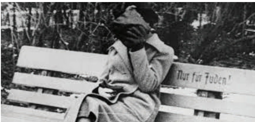
„Samo za Jevreje“