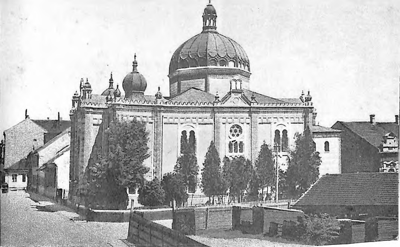
4. Sinagoga u Zrenjaninu, izgled sa južne strane