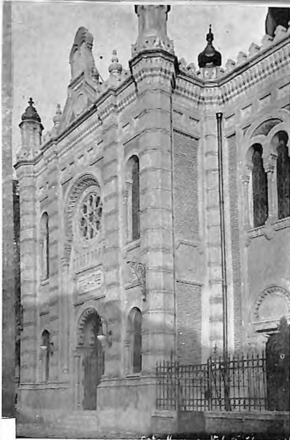
5. Sinagoga u Zrenjaninu, ulazna fasada