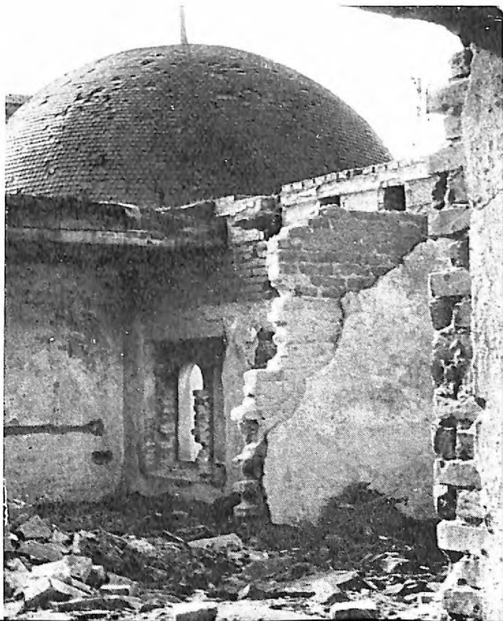
6. Ruševine sefardske sinagoge u Sarajevu