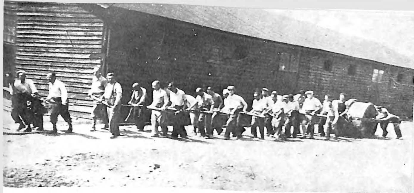
1. Jevreji na prinudnom radu u Vojničkom logoru u Sarajevu 1941. godine