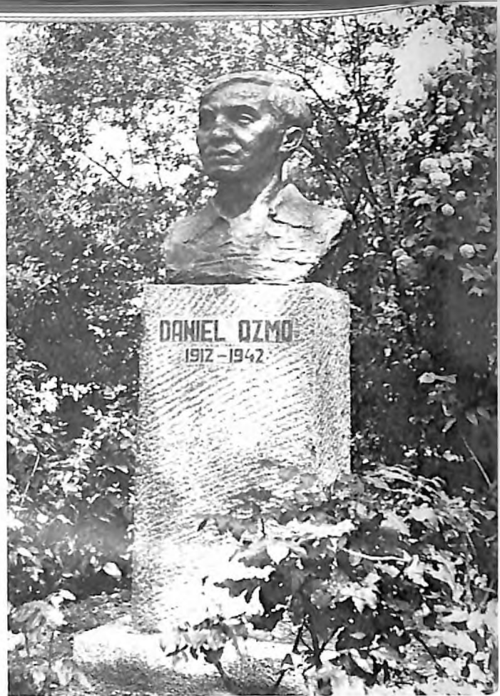
4. Spomenik Danielu Ozmu u Sarajevu, rad akad. vajara Predraga Hurltule