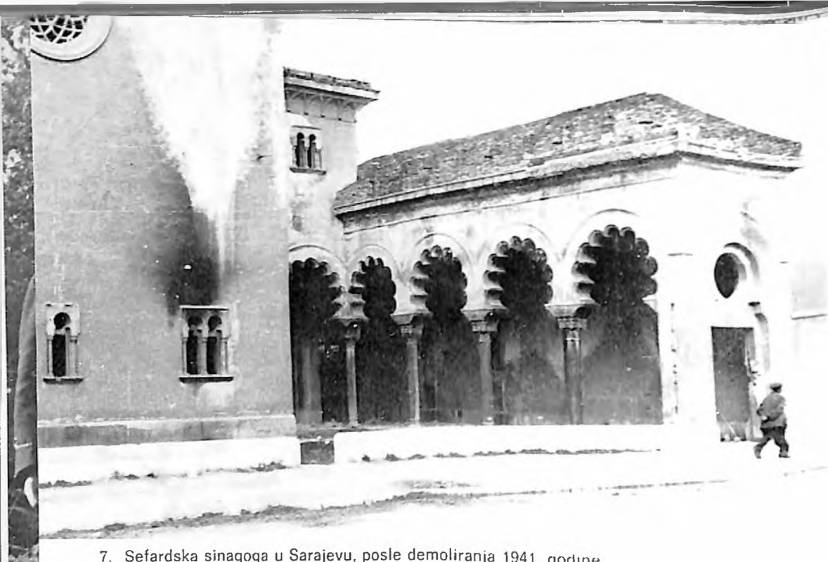
7. Sefardska sinagoga u Sarajevu, posle demoliranja 1941. godine