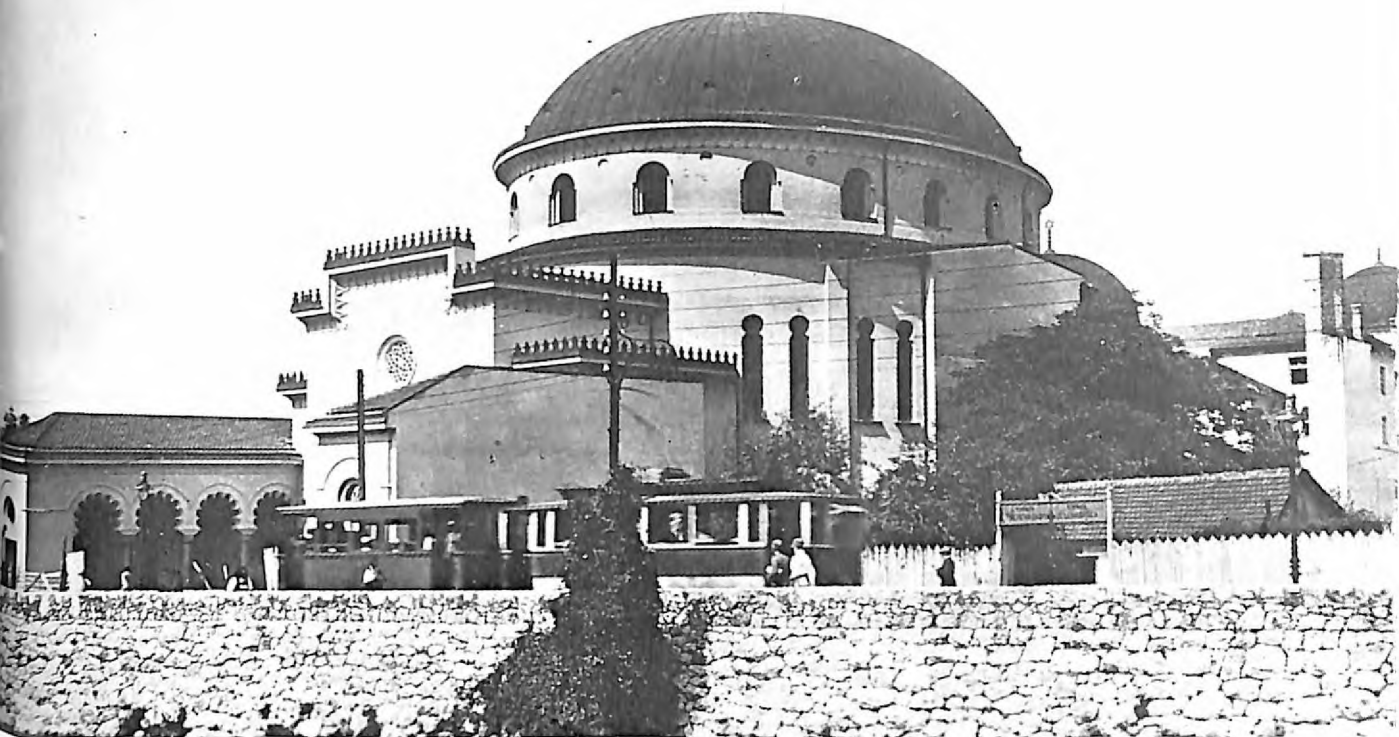
5. Sefardska sinagoga u Sarajevu, snimljena pre drugog svetskog rata