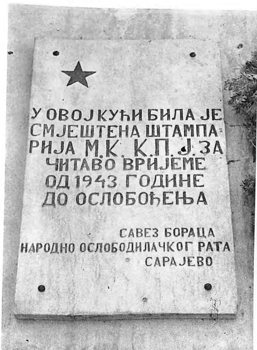
2. Spomen-ploča na kući Josipa Fohta i Sare Ozmo-Foht u Sarajevu