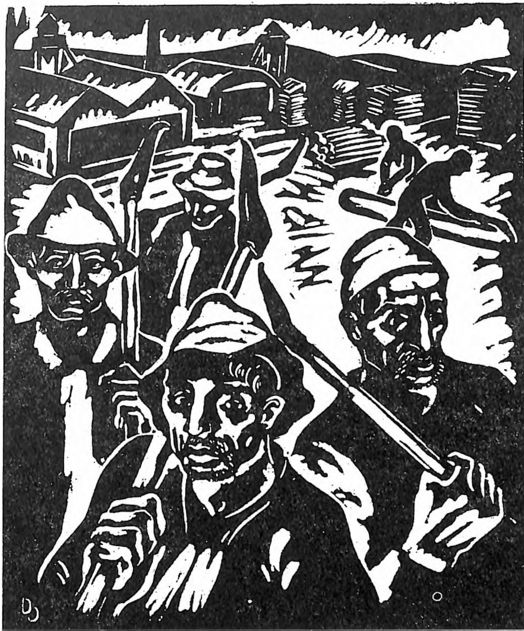
Daniel Ozmo, grafika iz mape Iz bosanskih šuma , linorez