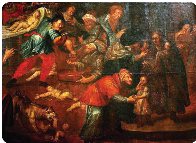
„Крвна клевета”, слика Карола де Превота, катедрала у Сандомјежу, Пољска (XVIII век)

Један од злонамерних митова о Јеврејима, настао још у XII веку, био је да Јевреји „отимају и убијају хришћанску децу да би ритуално користили њихову крв за верске ритуале”. Оптужбе да Јевреји врше „ритуална убиства” су део типичних антисемитистичких наратива који се, у различитим формама, појављују и данас.