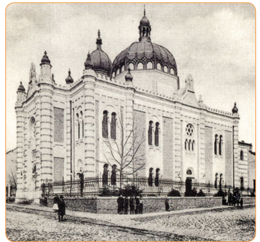
Синагогу у Зрењанину су срушили Немци 1941. године.

Јеврејске заједнице на простору Војводине су од друге половине XIX века настојале да свој просперитет искажу и подизањем што лепших синагога. Осим синагога у Новом Саду и Великом Бечкереку (данас Зрењанин), једна од најимпозантнијих је синагога у Суботици подигнута почетком XX века у стилу мађарске сецесије. У Војводини је постојало 78 синагога, од којих су данас остале само три. Многе су уништене за време Другог светског рата, а многе су пропале и срушене током деценија после рата због неодржавања и немара, јер су многе јеврејске заједнице потпуно уништене у Холокаусту, па више није било Јевреја да брину о својим локалним синагогама.