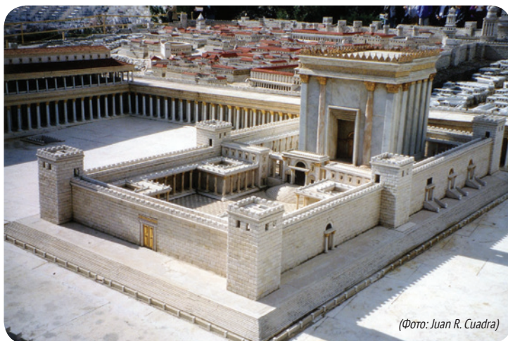
Модел јерусалимског храма у Музеју Израела

Првобитна историја Јевреја одвијала се на простору данашњег Израела, где су Јевреји, крајем другог миленијума пре нове ере, створили своју државу. Овај простор се назива и Палестина, по Филистејцима, народу са којим су Јевреји у то време водили борбу за превласт. Јевреји су били први народ који је прихватио монотеизам , односно веровање у једног бога. Најстарија јеврејска историја описана је у књизи коју Јевреји називају Танах , а хришћани Стари завет . У њој су садржана народна предања, правне и моралне норме, које су извршиле велики утицај на друге монотеистичке религије, хришћанство и ислам. У време цара Давида јеврејска држава је достигла врхунац моћи и пространства. Под његовим наследником, царем Соломоном, током X века пре нове ере, у Јерусалиму је подигнут велелепни храм . После Соломонове