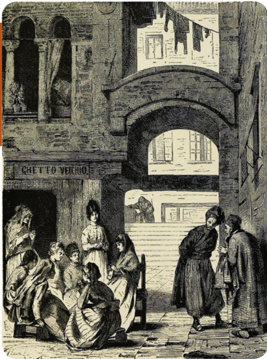
Гето у Венецији

На минијатури из средњовековне француске хронике приказан је прогон Јевреја из Француске 1182. године.