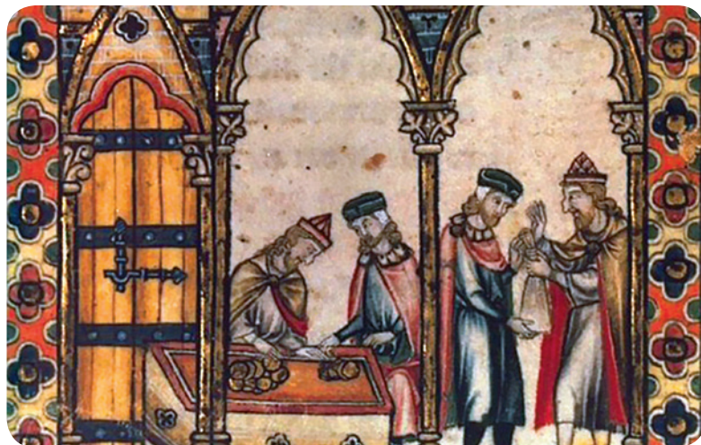
Јевреји, позајмљивачи новца у Француској, око 1270. године

Многи хришћански владари су забрањивали Јеврејима да поседују земљу. Како нису могли да се баве земљорадњом, Јевреји су живели углавном у градовима. Али, и у градовима им је било забрањено да се баве читавим низом професија или да тргују са одређеним врстама робе. Разлог овакве политике лежао је пре свега у чувању монопола и спречавању конкуренције домаћим трговцима и занатлијама, при чему је дискриминаторска политика оправдана различитим антисемитистичким предрасудама. С друге стране, хришћански владари су позивали Јевреје да раде за њих као скупљачи пореза или да се баве позајмљивањем новца (јер је црква забрањивала хришћанима да се тиме баве). Без много могућности избора, Јевреји су били принуђени да се баве оним занимањима која им у датом тренутку и на том месту нису била забрањена. Тако су, нпр. у Италији и Енглеској, припадници јеврејске заједнице често били кројачи. Неки су Јевреји били лекари, правници, тумачи, учењаци или су се бавили другим професијама за које је било потребно посебно стручно знање и вештина. Присиљени да буду стално на опрезу од нових протеривања и погрома, један од мотива за избор оваквих професија био је тај да, и ако им опљачкају имовину и отерају их, увек могу да своје стручно знање примене и у некој другој земљи.