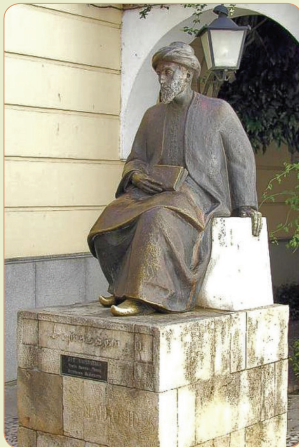
Рабин и филозоф Мојсије Мајмонид , споменик у Кордоби

У шпанској јеврејској заједници деловао је низ истакнутих стваралаца међу којима је најчувенији био рабин и филозоф Мојсије Мајмонид. Рођен је у Кордоби средином XII века, већи део живота је путовао, а коначно се настанио у Каиру и био лекар султана Саладина. Писао је на арапском и хебрејском, а његова дела из филозофије, јеврејске религије и традиције, као и из медицине су утицала на мисао широког круга учених људи.