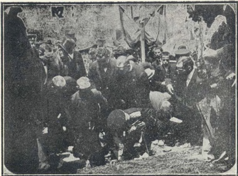
Nj. Velič Kralj saginje se i polaže kamen temeljac.

Pošto je svršena ceremonija Nj. Veličanstvo pružilo je ruku pojedinim članovima Uprave praštajući se. Srpsko Jevrejsko Pevačko Društvo isprati Kralja jednom pesmom, a narod dugotrajnim usklikom »Živeo«! Sedajući u kola Nj. Veličanstvo okrete se još jednom opštinskoj Upravi rečima: »Žurite se da me pozovete, kada bude vreme osvećenju hrama«.