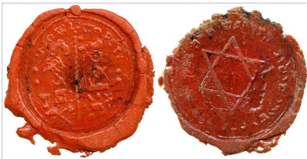
Somborski jevrejski pečat iz 1838. i pečat (signet) somborskog Jevreja Josefa Šterna iz 1855. god.

Tako je 1818. g. u nekadašnjoj Volfovoj ulici iza Stare pošte ili tzv. „Turske kuće“ (na mestu gde su ranije bile livade na kojima su pasli poštanski konji), podignuta omanja zgrada sinagoge, u kojoj je služio jedan rabin i koja je 1828. g. imala 50 muških i 40 ženskih sedišta. Te godine somborski Jevreji usvojili su Pravilnik o radu svoje crkvene opštine koji je bio napisan na jidišu i počeli su da vode zapisnike sednica. Prema zemljišnoj knjizi iz 1837. godine, posed na kome se nalazila sinagoga zauzimao je 254,5 kvadratna hvata. Godine 1838. u Somboru su živele 22 jevrejske porodice, 1846. g. 29 porodica, a 1861. g. bilo je u Somboru ukupno 211 žitelja jevrejske veroispovesti.