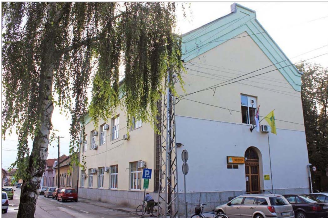
Nekadašnje zdanje somborske Sinagoge danas