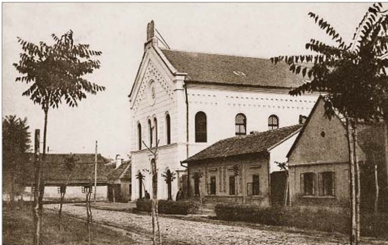
Sinagoga u Somboru, prvih godina 20. veka