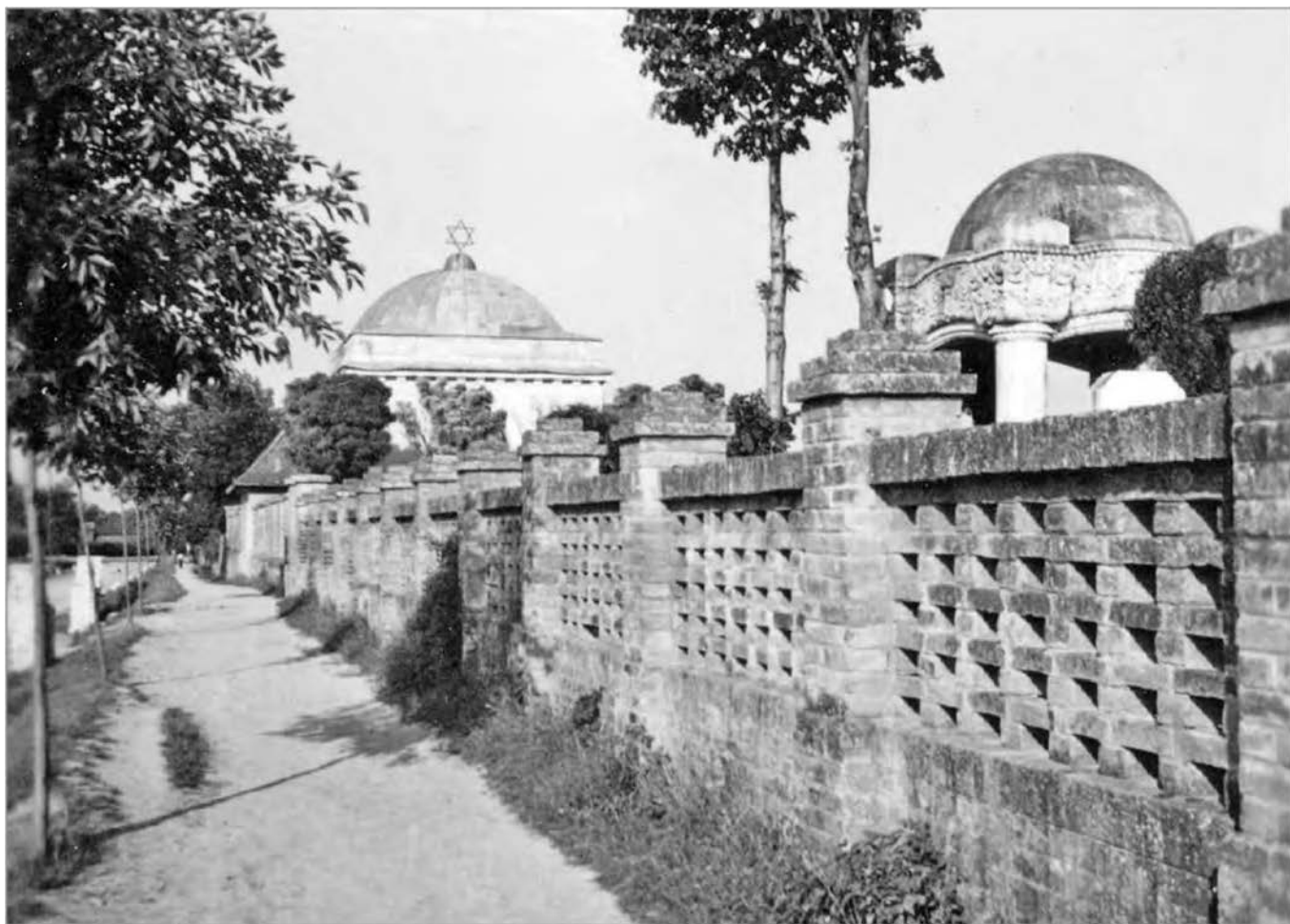
Somborsko jevrejsko groblje