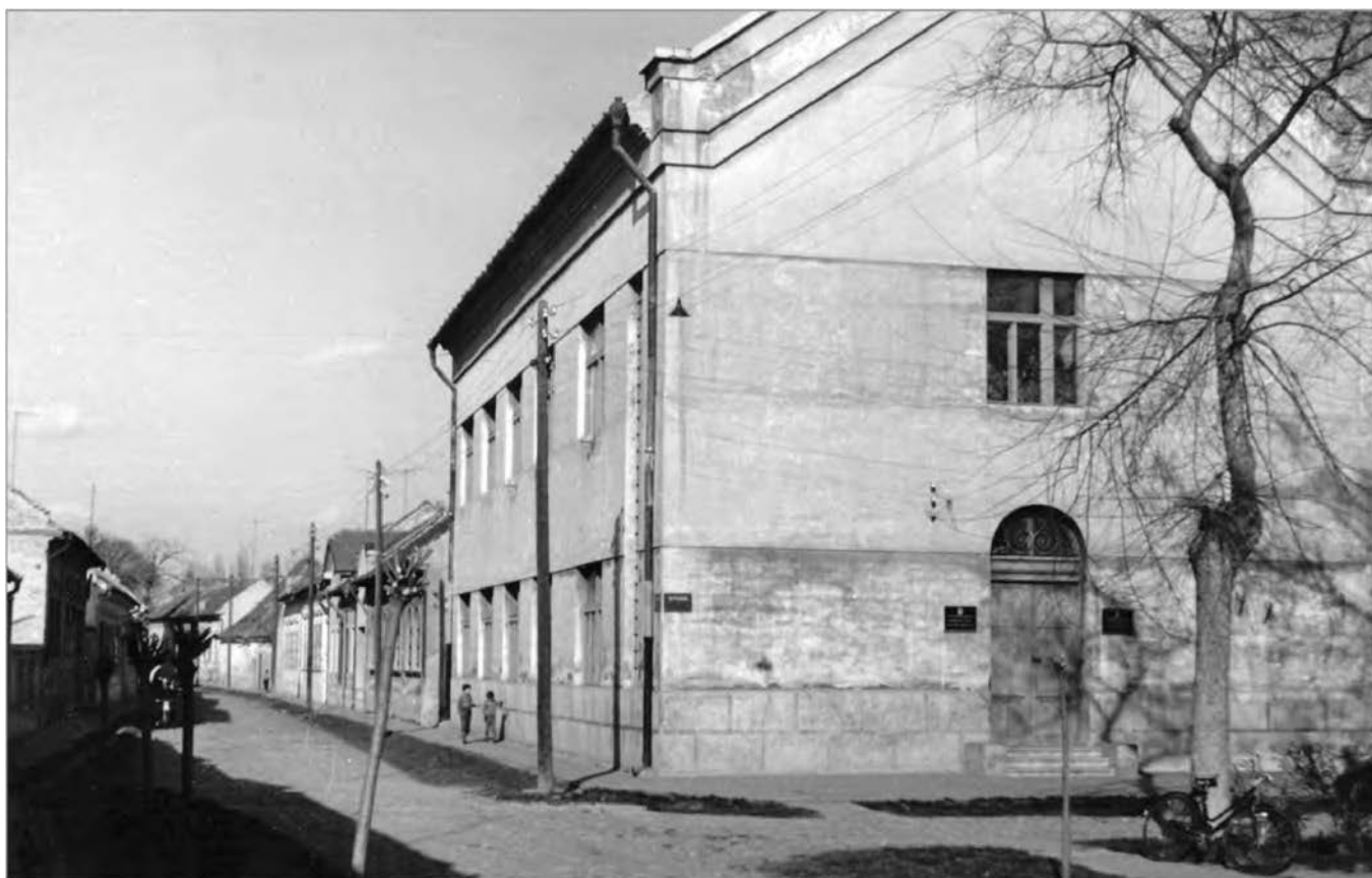
Sinagoga početkom druge polovine 20. veka

Pred Drugi svetski rat u Somboru je živeo oko 1.200 Jevreja, koji su doživeli strašan progon u proleće 1944. godine, kada su, većinom, otpremljeni u nemačke koncentracione logore Aušvic i Mauthausen, gde je, u holokaustu, stradalo preko 950 somborskih Jevreja. Preostali deo nakon rata se, uglavnom, raselio, a malobrojna jevrejska zajednica u Somboru poklonila je Sinagogu gradskim vlastima, koje su joj, zauzvrat, dodelile tri prizemne kuće u koje su prenete crkvene relikvije iz nekadašnje bogomolje.