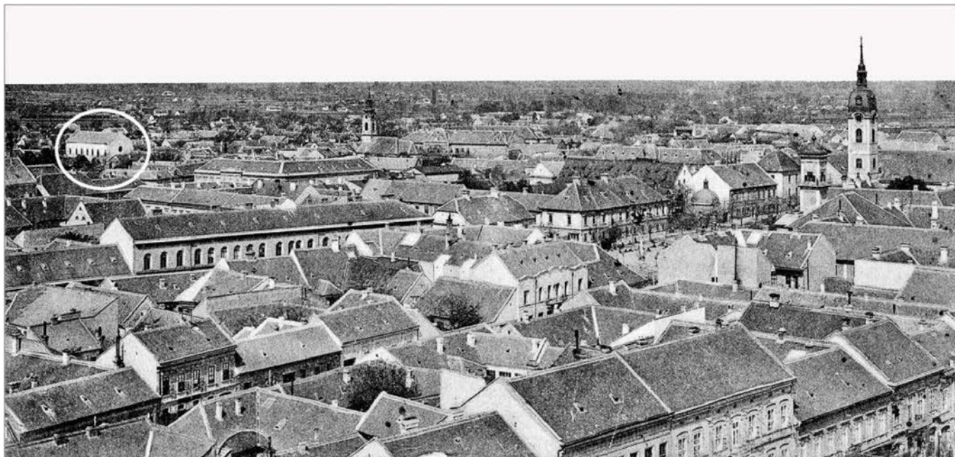
Zgrada Sinagoge (zaokružena) na panorami Sombora iz 1909. god.