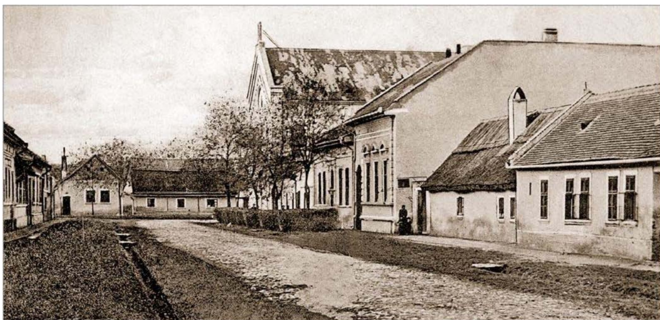
Sinagogina ulica u Somboru (početkom 20. veka) na čijem se uglu (ovde na sredini fotografije) nalazila Sinagoga podignuta 1864. god.