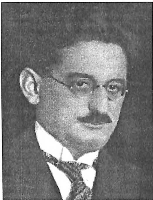
Dr Aleksandar Liht (1884–1948)

Rasprave o tome šta je preče na ravni potpore i pomoći: cionizam ili karitas nisu, međutim, prestajale. Kod svake deobe vođena je diskusija oko davanja prednosti potrebama siromašnoj braći u Srbiji, Jugoslaviji, Poljskoj, Rusiji... ili pokretu cionizma. "Da li, dakle (i