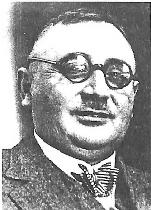
Geca Kon (1873–1941)