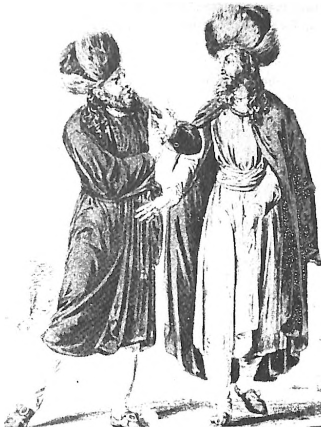
Jevreji iz Poljske sa početka XIX veka

osobito kada su u pitanju zanatlije, rukodelje, koji ne smeju biti druge vere osim "rimokatoličke, grčko sjedinjene i grčko nesjedinjene vere." 14