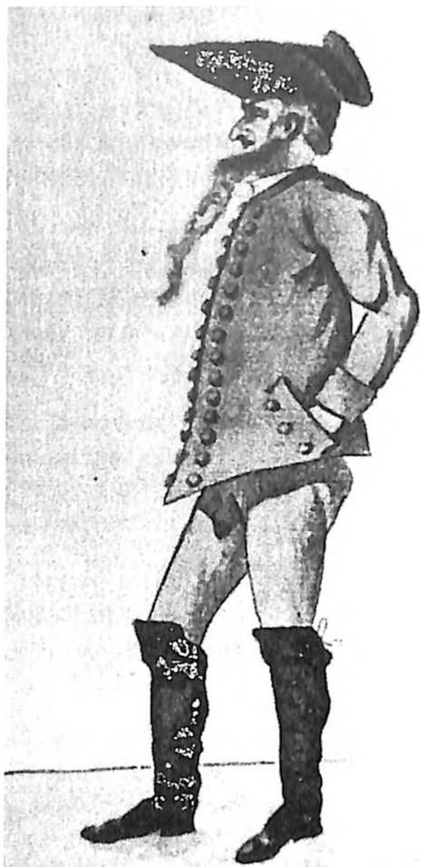
Jevrejin iz okoline Segedina sa kraja XVIII veka

Mada ovim zakonom Jevreji nisu dobili punu građansku slobodu, ipak je ukinut njihov ponižavajući položaj. Otvoren im je put ka građanskom napretku i emancipaciji pošto su priznati kao ravnopravan narod u Habsburškoj monarhiji.