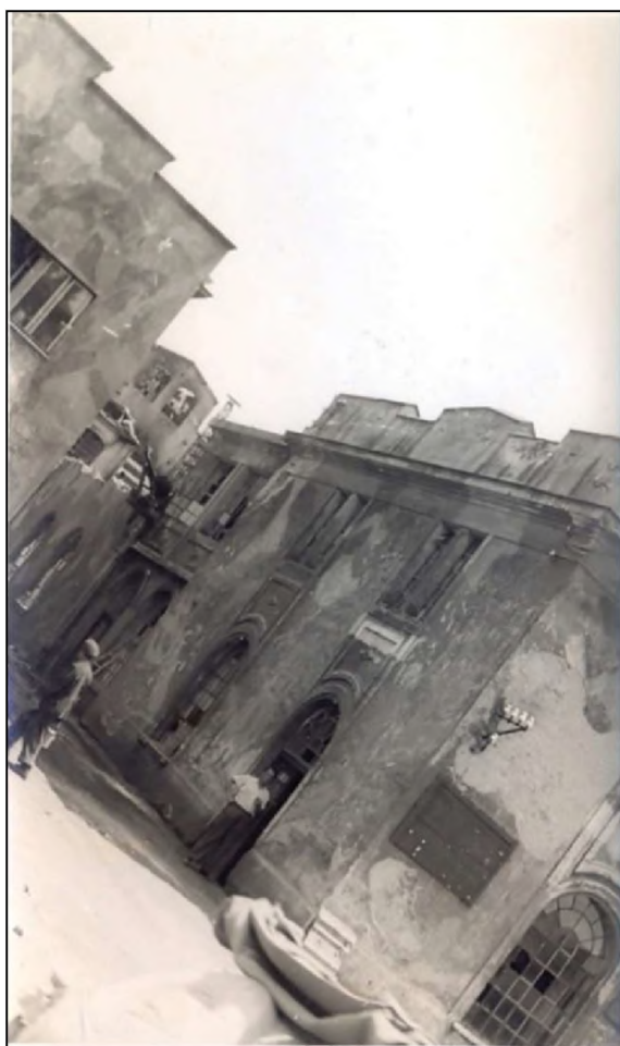
Sl. 5. Oštećena sinagoga 1941/1942.

porodici Frtuna, koji i danas imaju kuće na tom mjestu.