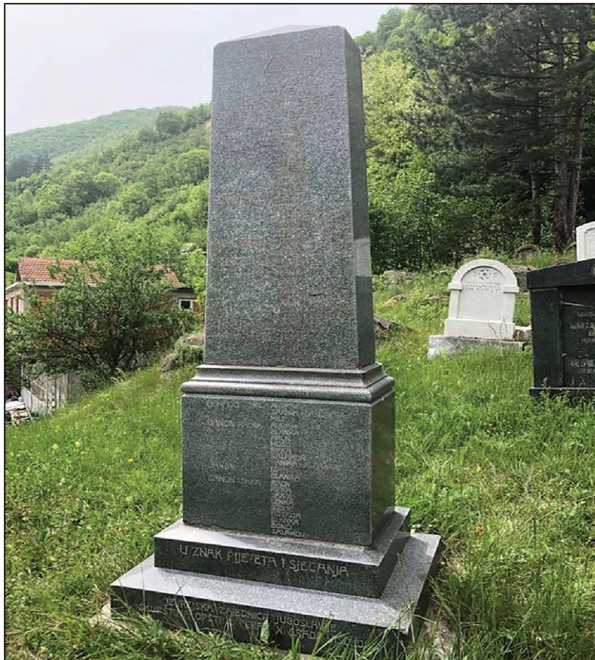
Sl. 7. Spomenik Jevrejima i palim borcima podignut 1979. god.