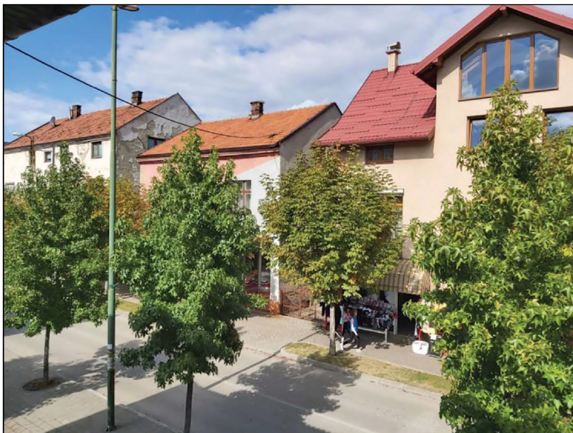
Sl. 2. Kabiljine kuće u Visokom

Kako je već spomenuto, Jevreji u Visokom pretežno su se bavili trgovinom i zanatima, ali bilo je tu za ono doba velikih poduzetnika. Jedan od onih koji se ističe jeste Elijas Kabiljo , koji je iz Sarajeva došao u Visoko te otvorio ciglanu koja je zapošljavala tridesetak radnika. 54 Kabiljo je gradio kuće i izdavao ih pod najam, a i danas se te kuće, koje se nalaze u Ulici Branilaca (tadašnja ulica Kralja Tvrtka), zovu Kabiljine kuće .