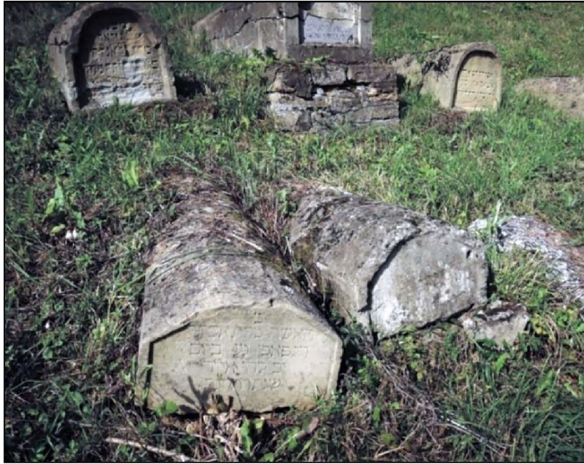
Sl. 6. Jevrejsko groblje