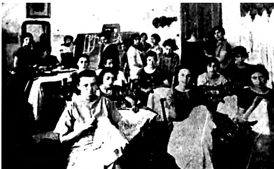
Učenice Više zanatske škole Jevrejskog ženskog društva (JIM)

Na osnovu raspoloživih podataka možemo zaključiti da je interesovanje za ovu školu bilo najveće školske 1923/1924, uz jedno ograđivanje, jer nemamo podatke za sledeću školsku godinu. Od školske 1925/1926. broj upisanih učenica znatno je manji, tako se školske 1921/1922. u I razred upisalo 18 učenica, a 1928/1929. samo 9 učenica. I pored toga što škola nije dugo opstala i što se tokom svog trajanja suočila sa mnogobrojnim problemima, njen najveći značaj bio je u tome što je omogućila siromašnim devojkama da steknu praktična znanja koja bi im mogla pomoći u daljem životu što je i bila ideja Jevrejskog ženskog društva kao osnivača škole.