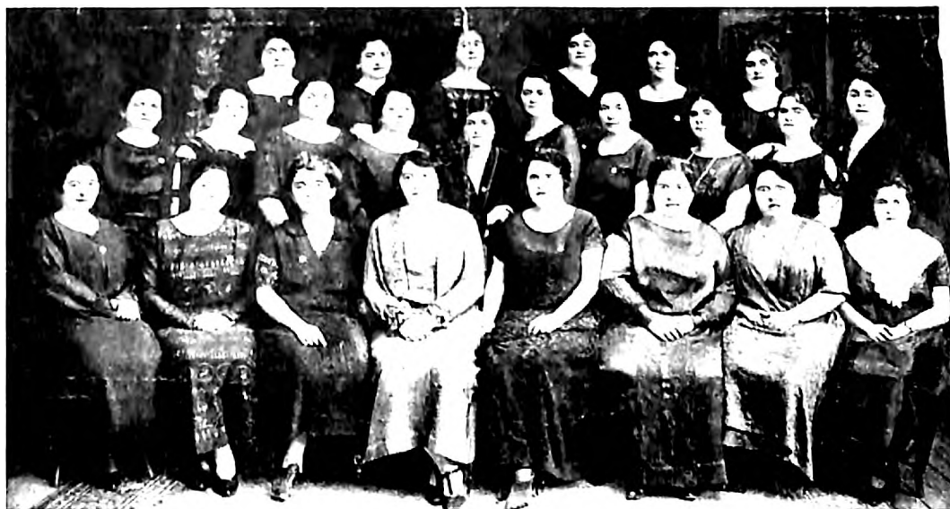
Članice Jevrejskog ženskog društva u Beogradu (JIM)