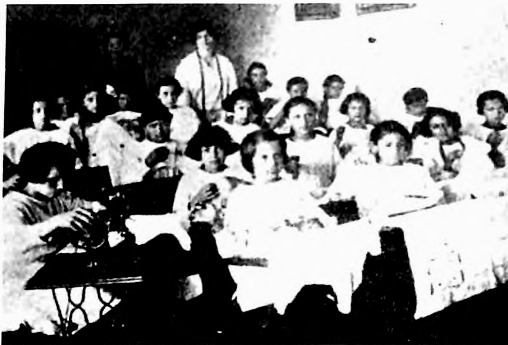
Učenice Niže zanatske škole Jevrejskog ženskog društva (JIM)

Mislilo se i na očuvanje jevrejske tradicije i nacionalnog osećanja pa su u školi na praznike Hanuka i Purim održavane školske svečanosti. Na ovim svečanostima je vrhovni rabin, Isak Alkalaj, držao prigodne govore. 54