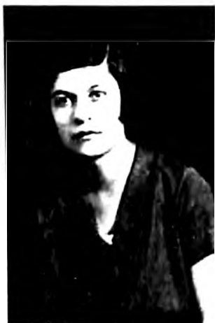
Olga Alkalaj (JIM)

Olga Alkalaj (1907–1942), pravница, aktivistkinja Ženskog pokreta i aktivna članica KPJ. Osnovnu školu i Drugu žensku gimnaziju završila je u Beogradu. Još kao gimnazijalka, primljena je u SKOJ. Posle završene mature, upisala se na Pravni fakultet u Beogradu. Kao studentkinja, 1923. postala je članica KPJ. Posle završenih studija i pripravničkog staža u državnoj službi, položila je advokatski ispit i otvorila advokatsku kancelariju. Branila je više članova KPJ pred Državnim sudom za zaštitu države, koji je ustanovljen 1929. Inicirala je osnivanje Omladinske sekcije Ženskog pokreta 1935. Članice ove sekcije bile su srednjoškolke, studentkinje i radnice.