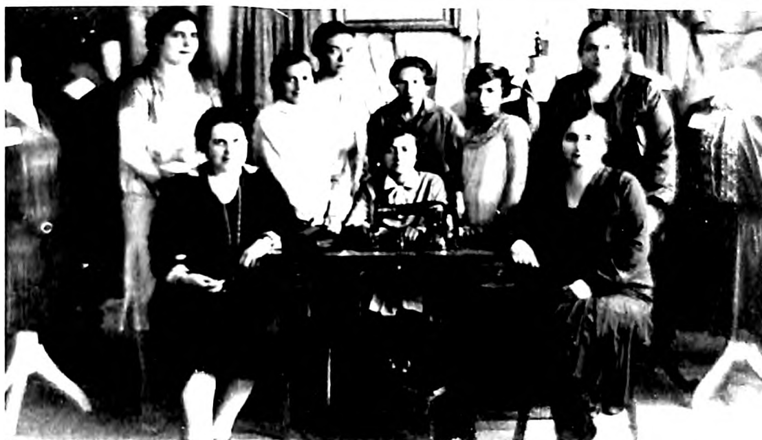
Zanatska škola Jevrejskog ženskog društva (JIM)