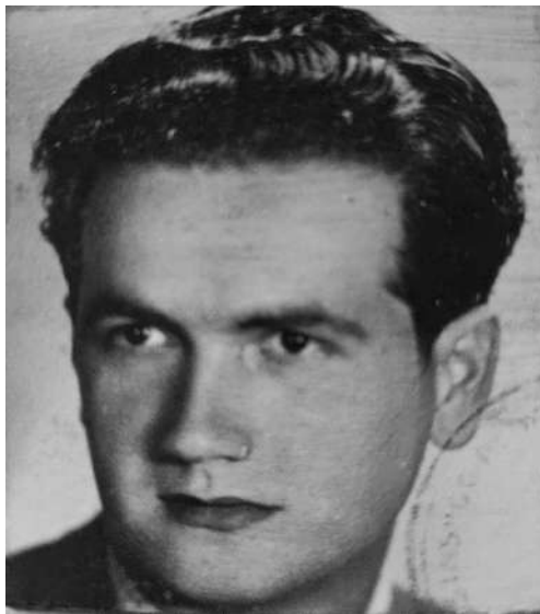
Сл. 9 и 10 - Емил Рифер и Иван Шавли (Архива аутора, Фонд Холокауст у Југославији, Независна Држава Хрватска, жидовска легијонација Емил Рифер; Иван Шавли )