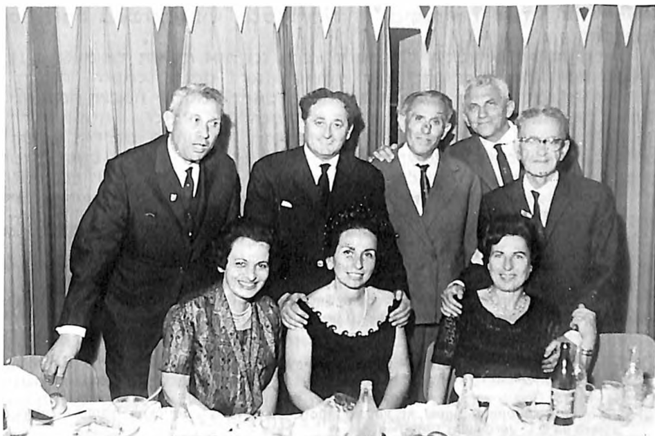
Sa drugarskog sastanka u Nahariji

מפרט ארועי מרד האסירים הצבאיים היוגוסלביים — חברי התנועה הפרטיזנית, ביניהם יהודים רבים ב-2.3.1944 ככלא שאטוראליה או "הא" צפון הונגריה. רובם נפלו בקרב ונרצחו בשוויים.