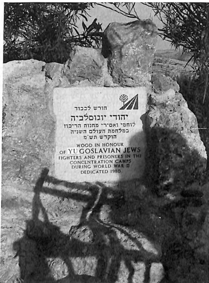
Ploča u šumi "Jar Herzi" לוח ב"יער הרצל"