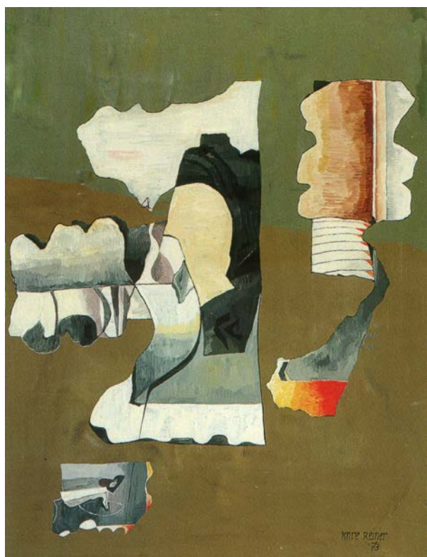
Dedal, opus III, 1973

Ređaju se i izložbe van Švajcarske: Antwerpen (Muzej Royal de Beaux-Arts, 1948), Filadelfija (Print-Club, 1949), Pariz (Galerija A. Loewy, 1950), Hamburg (galerija Dr. A. Hauswedell, 1952), Dortmund (Muzej Ostwall, 1953), Sao Paulo (Museum de Arte, 1954), Čikago (Apprentice-House, 1956), San Francisko, Milano, itd. Dobija brojne nagrade: »Bienale Bianco e Nero« (1964), »Accademia Fiorentina delle Arti del Disegno« (1962) i dr., 1962. izabran je za počasnog člana Akademije primenjenih umetnosti u Firenci 28 .