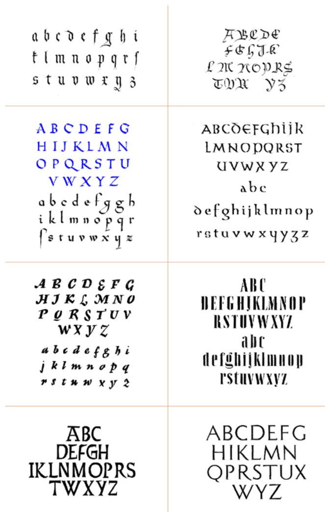
Neki od tipova alfabeta koje je dizajnirao Imre Rajner

Kada je otpočeo Drugi svetski rat, i kada je nemačka vojska stajala na granici sa neutralnom Švajcarskom, Imre Rajner, bez državljanstva, nije imao kud nego da ostane u Švajcarskoj, gde će provesti sve vreme rata. Njegov rodni grad Vršac bio je okupiran od strane nemačke vojske 11. aprila 1941. Otpočeo je teror prema jevrejskom stanovništvu, i do kraja godine je skoro u potpunosti sproveden plan za uništenje jevrejskog stanovništva u Banatu. Imre Rajner je imao tu sreću da je već početkom 30-tih godina poslušao svoj instinkt i odlučio da napusti Nemačku.