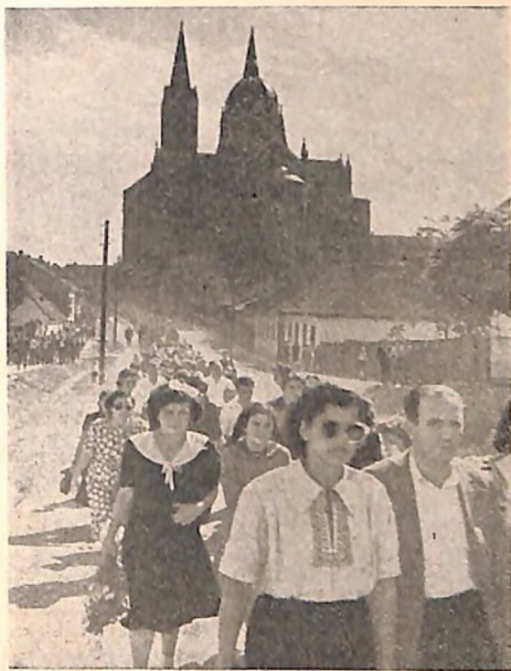
Povorka prilikom osvećenja spomenika jevrejskim žrtvama u Đakovu

u istoriskom centru Pariza a drugi u Njujorku, (rad arhitekta Mendelsohna i našeg vajara Ivana Meštrovića), za koje je Maršal Tito darovao jugoslovenski granit, kao i mnogi drugi spomenici, spomenploče i muzeji u raznim gradovima, u ranijim logorima uništenja i na mestima gde su bila masovna gubilišta, — jesu ono što slobodoljubivo i progresivno čovečanstvo polaže kao obol svoje pošte i opomene na strašne dane.