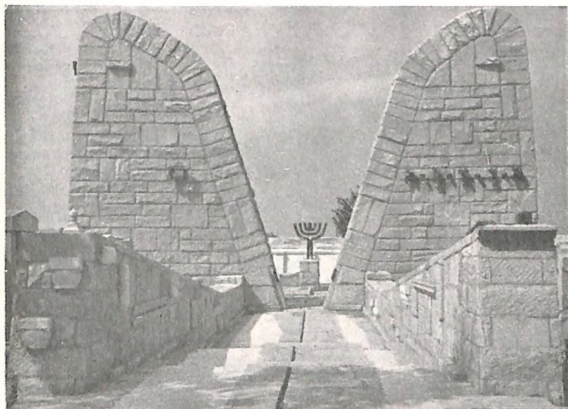
Spomenik jevrejskim žrtvama u Beogradu (arhlt. B. Bogdanović)