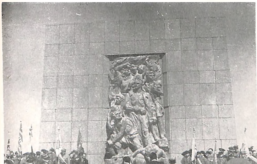
Spomenik ustanicima geta u Varšavi