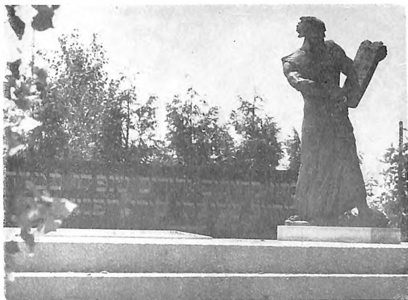
Spomenik jevrejskim žrtvama u Zagrebu (Skulptura A. Augustinčića)