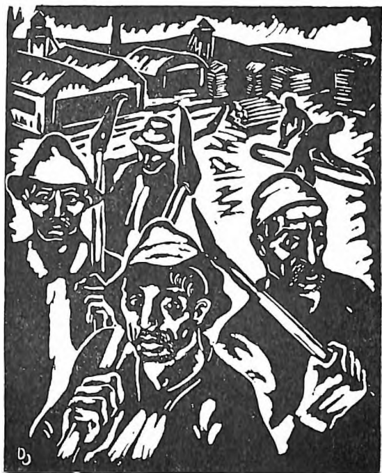
Danel Ozmo: Capinaši (linorez)