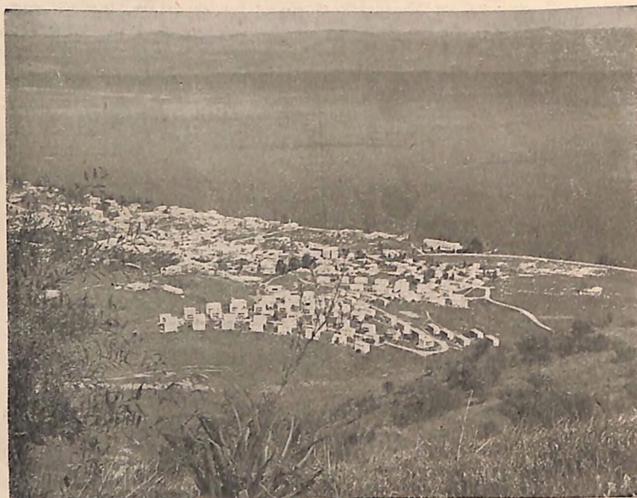
Novosagrađeno naselje na obali Tiberijanskog jezera

U 1950 godini donet je zakon za potsticanje investicije kapitala. Sada postoje dva oblika investiranja: putem privatnog stranog kapitala u zajednici sa lokalnim novčanim sredstvima, na bazi polapola između stranih investitora i „Histadrut“-ovih kooperativnih preduzeća. U nekim slučajevima sindikalna preduzeća učestvuju čak sa apsolutnom većinom deonica. Skoro sve ključne industrije u kojima učestvuje strani kapital, pripadaju ovom drugom tipu investiranja (industrija cementa, metalna industrija, automobilske gume