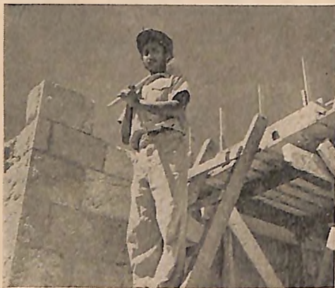
Novi useljenik iz Jemena

U 1950 prihvaćen je drugi metod absorbovanja imigranata. Novi se sistem sastojao u prebacivanju imigranata u privremena naselja nazvana maabarot, u područja gde su uslovi za rad bili povoljniji ili na mesta koja su planirana da postanu sela ili gradovi, ne čekajući na dovršavanje stalnih stanova. Obezbeđeni smeštaj useljenika u maabarot bio je privremen, jer se istovremeno pristupilo i izgradnji stalnih naselja. Stanovnici maabarot nisu dugo bili upućeni na pomoć države. Oni su i sami mogli da stiču sredstva za život radeći na obližnjim javnim radovima, pošumljavanju i osposobljavanju zemljišta za obradu, irigacionim radovima, u izgradnji puteva ili u pojedinim industrijskim ili poljoprivrednim preduzećima. Planovi su bili usmereni na to da se veći broj maabarot razvije u poljoprivredna naselja ili nova predgrađa ili nezavisne gradove. 50 maabarot postale su do kraja 1952 god. autonomna poljoprivredna područja.