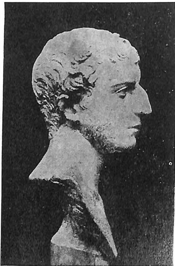
Bista Josifa Flavija u Glptoteki u Kopenhagenu

U svojoj autobiografiji, odmah posle pasaža koji smo citirali, on produžava da se hvali svojom pameću i memorijom. Kaže da su ga, kad mu je bilo 14 godina, posećivali sveštenici i drugi ugledni ljudi da ga pitaju o pojedinim stavovima iz Tore. U šesnaestoj godini odlučio se da sam, kao član, aktivno ispita sve tri tadašnje sekte: farisejsku, sadukejsku i esensku. Čak je kao pustinjač pro-