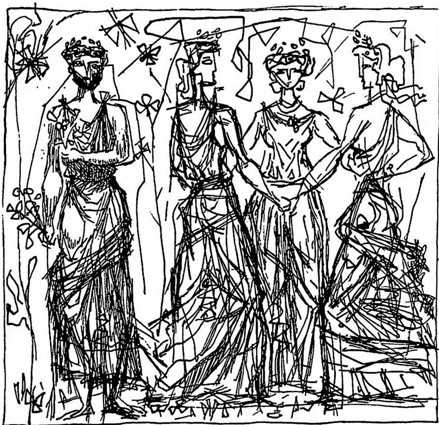
Dida Demajo: Crtež

na grafičkoj opremi knjiga i drugih edicija. Posebnom ljubavlju posvećuje se radu na delima koja su svedočanstva nedavnog rata, stradanja i borbi, ali se njegov istančani smisao za lepo i vedro ogleđa i u saradnji na izdanjima koja prikazuju prirodna i umetnička blaga naših krajeva. Radi za »Vojno delo«, »Jugoslaviju«, »Jež«, »Prosvetu« i izdanja invalidskih organizacija, a upravo u poslednjim danima spremna grafičko rešenje za knjigu »Stara je-