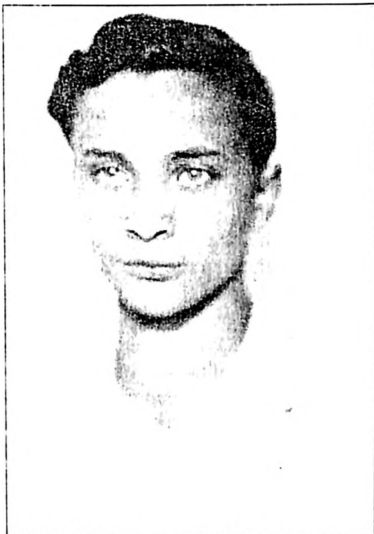
Fuks iz perioda kad se za dan sazrevalo kao u nekoliko mirnih godina

Imao sam na sebi samo kratke pantalone, košulju i lagan sako. Na mom telu znoj se ledio. Osim male naprtnjače, nosio sam još jednog malog dečka, čija majka nije imala snage da savlada njegovu težinu. Stariji čovek, koji je odbio da se otarasi svojih stvari u koferu, uprkos opomeni da ne nosi težak prtljag sa sobom, izgubio je ravnotežu na uskom stenovitom grebenu i pao kričeći niz liticu, od nekoliko stotina metara, u smrt.