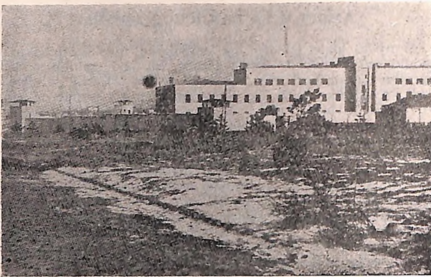
Pogled na deo banjičkog logora

U januaru 1943. pojavila se epidemija pegavca, koju su doneli zatvorenici preseljeni sa Sajmišta, te su svi Nemci, koji su boravili u logoru, bezglavo napustili Banjicu, a u samom logoru sprovedene su mere za sprečavanje širenja ove epidemije, — svakako ne zbog zatvorenika, već zbog logorskih vlasti i straha od širenja epidemije po gradu. Tada je u logoru uveden karantin, zatvoreni-